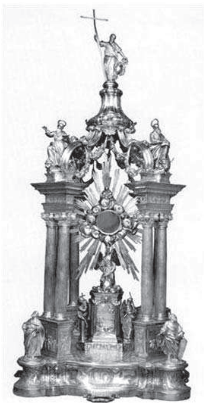
2. DAMIÁN DE CASTRO: Custodia procesional (1781). Parroquia de La Asunción, La Rambla (Córdoba) .

otro elemento del cortejo procesional (guión sacramental, placas de estandar-te, pértigas, ciriales, andas...). Pero en definitiva, nada de lo dicho resta un ápice de "fulgor" a tan sugerente muestra.