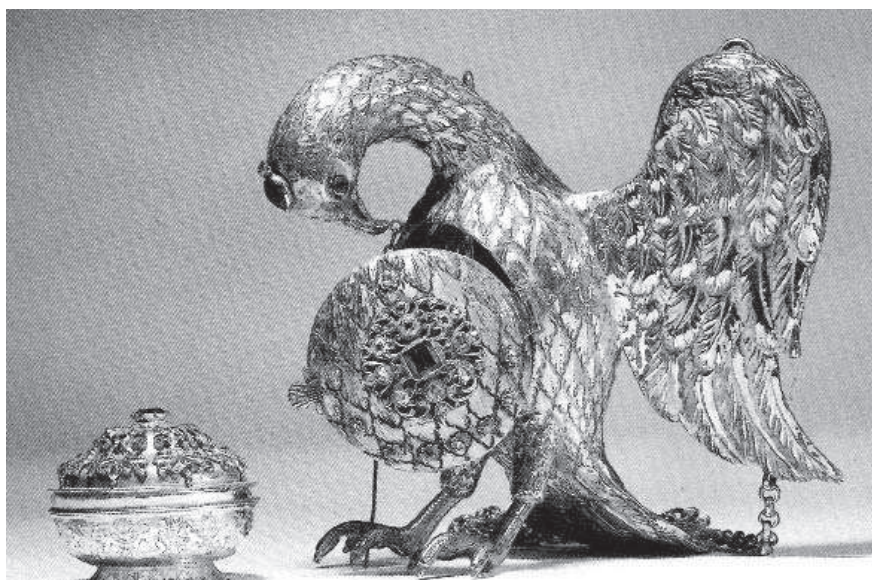
3. "Pelicano Portaviático" (s. XVIII). Parroquia de Santa María del Soterraño, Aguilar de la Frontera (Córdoba)".