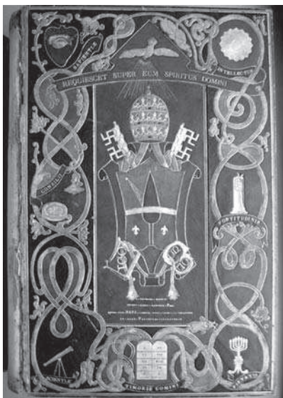
3. Libro Homenaje de la Diócesis de Málaga (Cubierta).