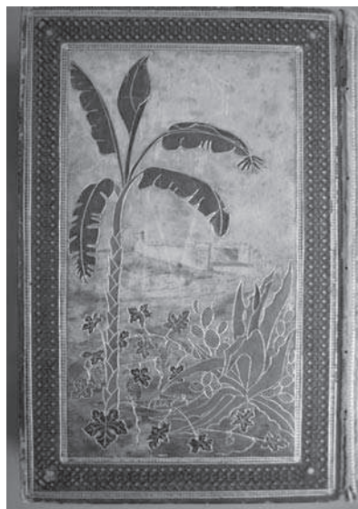
4. Libro Homenaje de la Diócesis de Málaga (Contracubierta).

Le rodean emblemas o atributos acompañados por el vocablo inciso: SAPIENTIAE (ojo), INTELLECTUS (sol), CONSILII (brújula), FORTITUDINIS (la columna), SCIENTIAE (telescopio), PIETATIS (candelabro de los siete brazos), TIMORIS DOMINI (tablas de la Ley) 8 . Todos los motivos se agrupan ordenadamente, entrelazados por cintas y filacterias, a modo de roleos de raigambre manierista [3].