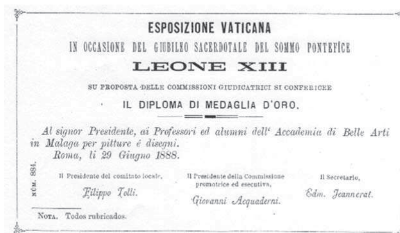
7. Diploma de Medalla de Oro concedido al Presidente, Profesores y alumnos de la Academia de Bellas Artes de Málaga. Roma, Exposición Vaticana, junio 1888.

Y es esta misma crítica, tanto la italiana como la española la que nos permite conocer las obras, pues da puntual noticia de las colaboraciones. Además la Academia Provincial de Bellas Artes, para dejar constancia de esta iniciativa y clamoroso éxito, en 1889 decidió reunir en una pequeña publicación las noticias recogidas de diferentes periódicos, tanto locales como el órgano oficial de la exposición, a las que acompaña un índice de los trabajos presentados 19 . A través de ellos tenemos la descripción de las obras, aunque evidentemente resulta limitada.