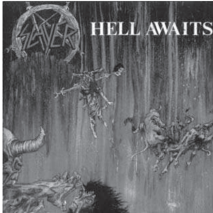
8. Slayer. Hell Awaits (1985).