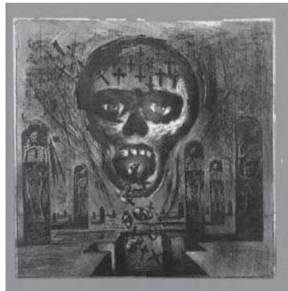
13. Slayer. Seasons in the Abyss (1990).

la planitud. En su siguiente trabajo de 1988 South of Heaven [12] (Al sur del cielo) una enorme calavera, símbolo de la futilidad de la vida, preside la escena. Rememorando el tema tan ampliamente tratado de la muerte en el infierno por la pintura flamenca. Poblada esta por animales y seres zoomorfos, la escena se encuentra enmarcada por sendas iglesias góticas. Los condenados han desaparecido de la escena engullidos por un torrente de sangre, un remolino que bien nos puede recordar la potencia con el Maelstrom engulle a barcos y personas en el relato de Edgar Allan Poe Un descenso al Maelstrom .