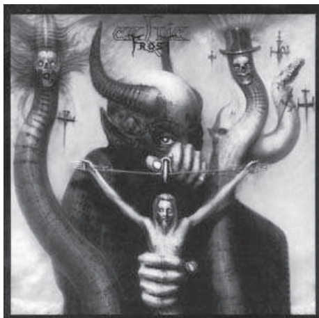
4. Celtic Frost. To Mega Therion (1986).

le había arrancado un collar a Satán y lo había arrojado por el aire, y ésta es la estrella de cinco puntas” 29 .