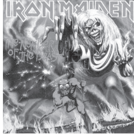
3. Iron Maiden. The number of the beast (1982).

de 1987 de Bathory Under the sign of the black mark (Bajo el signo de la marca negra). De esta forma se acentúa su naturaleza ctónica. En ambas imágenes el carácter inquietantes y amenazador esta subrayado por la mirada que nos interpela, además en la primera de ellas el fuego nos sugiere el anhelo de destruir el tiempo y llevarlo todo a su final 24 , además la espada denota su carácter indómito de libertad y de fuerza 25 .