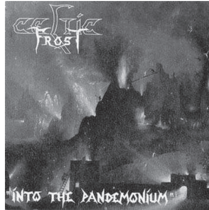
9. Celtic Frost. Into the Pandemonium (1985).

Esta imagen de un infierno de fuego y de torturas a los condenados es la que podemos encontrar en la portada del segundo álbum de Slayer de 1985, Hell Awaits [8] (El infierno espera). Entre las llamas de la condenación podemos ver como en primer término un demonio se dispone a torturar a un condenado ante el rostro de desesperación de este. Mientras tanto, un grupo de tres demonios como despedazan a un condenado, y en último término otro demonio sobre las espaldas de un condenado con una gran espada con la cabeza de un decapitado. El fuego que aquí aparece nos remite al fuego de la condena como lo describe Lactancio a principios del siglo IV "...es puro, quema sin humo, fluye como el agua, no se eleva, se nutre de los condenados al mismo tiempo que los reconstituye" 48