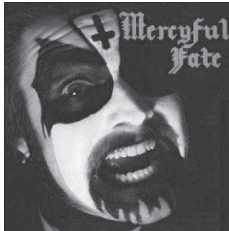
5. Mercyful Fate. Black Funeral (1983).

Con un carácter mas irreverente podemos ver la portada del EP de 1982 de