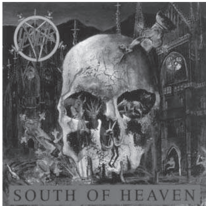
12. Slayer. South of Heaven (1988).