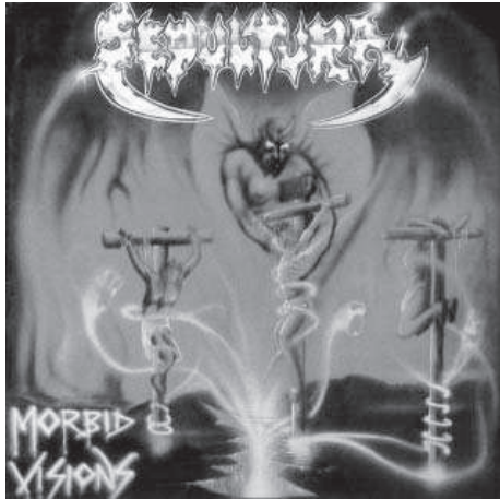
6. Sepultura. Morbid Visions (1986).