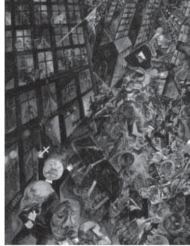
10. Slayer. Reign in blood (1986).