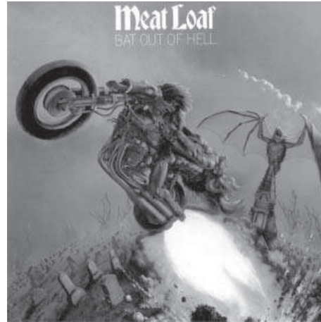
1. Meat Loaf. Bat out of hell (1977).

dos personajes que aparecen, un descomunal murciélago con sus alas coriáceas extendidas sobre una cripta y el motorista que surge de la tierra. Aunque la figura del murciélago puede tener significados contradictorios 15 , dentro de la cultura occidental ha tenido en su mayor parte un significado negativo. Su uso en este contexto haría referencia a la muerte y el alma 16 , ya que si atendemos a la letra de la canción se trata de un murciélago que escapa del infierno por la noche. Así, ambas representaciones harían referencia a una misma naturaleza, una naturaleza monstruosa (dionisiaca) que se enfrenta a las leyes de la razón y la proporción (apolíneo).