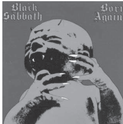
14. Black Sabbath. Born Again (1983).

Una infancia en apariencia mucho más tranquila y bien intencionada es la que ilustra el álbum Possessed (Poseídos) de 1985 de Venom. La imagen de dos niños se nos muestra en un negativo fotográfico para poner de manifiesto el carácter sobrenatural de la posesión. En los Evangelios se le da credibilidad al tema de las posesiones diabólicas, en el siglo III se crea el ministerio de exorcista y en 1614 el Papa Pablo V publica el Ritual Romano , todavía hoy utilizado, que se utiliza en las ceremonias y métodos del exorcismo; en el se especifica que los niños no pueden estar presentes en un exorcismo extraordinario porque al salir el demonio de un cuerpo podría entrar en el suyo al estar indefensos 56 . Que es lo que parece que les ha ocurrido a los protagonistas de esta imagen.