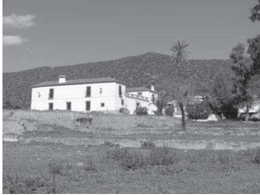
2. La Jarilla. Visión general y huertas.

Así se recoge también en las respuestas generales del Catastro de Ensenada fechado en 1752 24 , desarrollándose bastante más en las comprobaciones que de las particulares se realizan una década después. Aparece este bien dentro de ellas de la siguiente manera 25 :