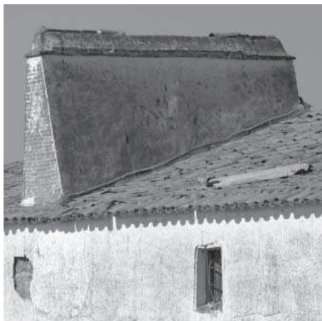
10. Cortijo de Maricara. Chimenea.

modo hogar, como otras tantas de la provincia de Badajoz.