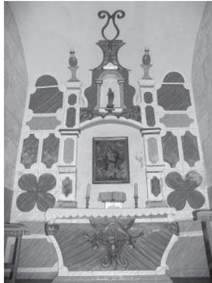
5. La Jarilla. Retablo de la capilla.

La misma cronología nos ofrece el Cortijo de la Jarilla de Enmedio, de sabor más popular y compuesto por una vivienda a la que se adosan lateralmente otras dependencias, con la presencia de una chimenea semejante a la que veremos en el Cortijo de Maricara. Posee un tentadero cercano y unas interesantes zahúrdas para los cerdos.[6]