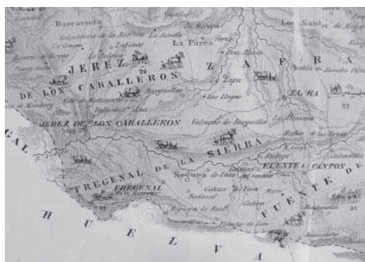
7. Detalle de La cría caballar en España. Provincia de Badajoz (hacia 1861), Coronel de Caballería Juan Cotarelo (CENTRO GEOGRÁFICO DEL EJÉRCITO. CARTOTECA HISTÓRICA. Mapas de Extremadura, n° 97).

Pero sin duda es el conjunto llamado hoy La Jarilla al que debemos acercarnos con mayor detalle. Ubicado a unos 5 kilómetros del núcleo urbano, se extiende a su alrededor un bello paisaje de encinas y otros árboles a la cola del embalse de Nogales desde donde arranca la ladera de la Sierra de María Andrés, cuyo punto más elevado es de 702 metros de altitud.