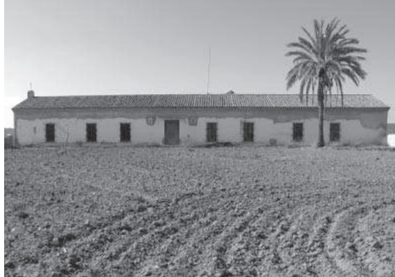
9. Cortijo de Maricara. Fachada principal.

En 1863 aparece como una "casa de guarda" con un solo edificio en el Nomenclátor de este año 37 , mientras que en el de 1888 38 ya se presentan tres donde vivían 17 personas.