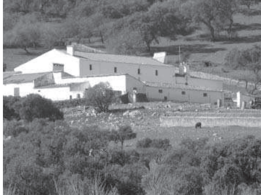
13. Monsalud. Cortijo El Regio. Vivienda principal y capilla.

(en el camino de este Pueblo à Salvatierra) algunos estrivos que formando una sierra menos elevada, pero aspera por los peñascos y monte bajo de que está cubierta van a unirse en Salvatierra, con la continuación de la de los madroñales. Solo atraviesa la Sierra de Monsalud una trocha ó vereda que va de Nogales á Salvaleon, pasando en su cima por el Puerto, que llaman de los Maderos. En la imediacion de su mayor altura tiene una fuente que aunque no de mucho caudal, mana siempre.