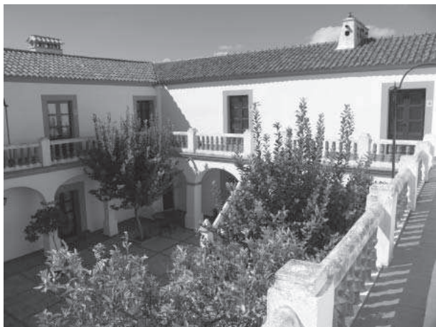
8. La Jarilla. Patio.

dispuestas en forma de bancales y que tan atractivas se nos describen en la documentación manejada ya durante el siglo XVIII.