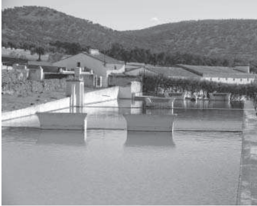
4. La Jarilla. Piscinas y área de recreo.

con las residenciales. Entenderemos, por tanto, este conjunto arquitectónico como una granja típica de una institución religiosa en la que quedan unidos durante siglos los componentes mencionados, utilizada también por sus monjes para su recreo y descanso, además de desarrollarse una destacada labor cultural. [4]