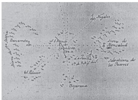
6. Croquis de Salvaleón, Tomás López (finales siglo XVIII) (BIBLIOTECA NACIONAL (Madrid) MS. 20241/31).