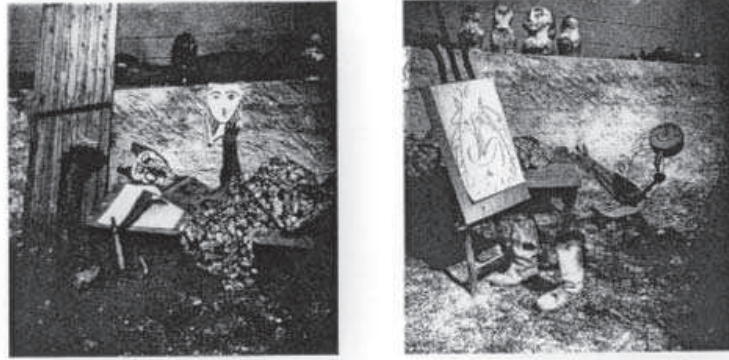
1. A la derecha aparece la evocada "Charlotte Corday" por Picasso y Frédéric Rossif. A la izquierda otra imagen de La mort de Charlotte Corday de 1950, "El pintor y su modelo".