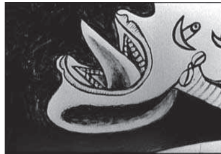
6. Fragmento del Guernica de Picasso, utilizado por Alain Resnais y Robert Hessens para el cortometraje Gernica .

por graffitis. Podemos distinguir el ruido de las ametralladoras y las sirenas, a la par que comienzan a aparecer cuerpos descoyuntados.