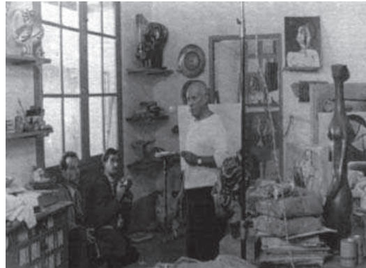
8. Picasso en su taller de Vallauris. Imagen perteneciente a la película Picasso de Luciano Emmer.

aspectos como la mirada, gestos y reacciones del pintor, así como el curso que seguía su brazo y el pincel en cada trazo, la aplicación de las acentuaciones formales, en qué elemento ponía mayor o menor énfasis. La transparencia de este nuevo lienzo permitió acceder a la manera física, los movimientos corporales y la actitud tomada por Picasso cuando se enfrascaba en sus procesos creadores.