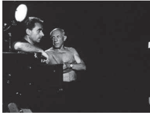
2. Picasso y Henri-Georges Clouzot durante el rodaje de Le mystère Picasso .

Tras ese encuentro, Picasso recibió procedente de Estados Unidos unos dispensadores de tinta que traspasaba el papel y que, como se observa en la película, eran un prototipo de rotulador.