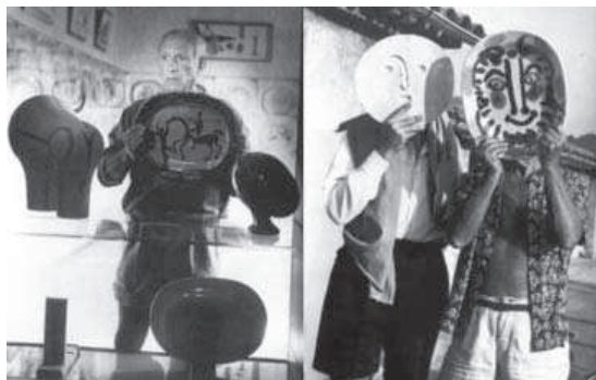
4. Imágenes de la película La vie commence demain de Nicole Védres , donde Picasso aparece en su taller de Vallauris junto a diversas piezas de cerámica y bromeando junto a Jacques Prévert.