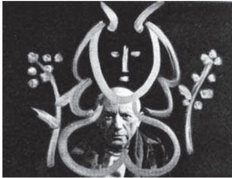
7. Imagen de la película Visite à Picasso de Paul Haesaerts.

La citada obra cinematográfica, perteneciente a Alain Resnais y Robert Hessens, no fue la única que se centró en la obra “Guernica” de Picasso. Con anterioridad, cabe destacar la aparición de determinados testimonios, tanto por escrito como en soporte audiovisual, que centran su interés en la obra mencionada del pintor y la dotan de un carácter vinculado al cine.