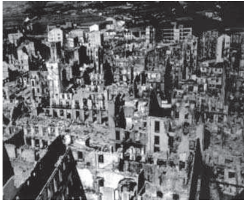
5. Imagen de la ciudad de Guernica tras el bombardeo nazi en Abril de 1937, perteneciente a la película Guernica de Alain Resnais y Robert Hessens.