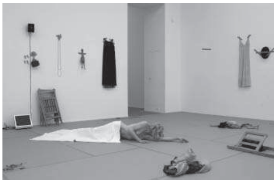
1. Muriéndose la sirena en Panoramix, 2003.

La Ribot reinventa la danza desde la potencialidad de significados del cuerpo desnudo, desde su neutralidad, vulnerabilidad y nobleza; la desnudez está alejada de cualquier sentido erótico. La desnudez potencia la danza de la inmovilidad, la de los movimientos incontrolados del cuerpo, la del temblor de la piel o el sonido de la respiración como sucede desde la primera pieza , Muriéndose la sirena (n.1).