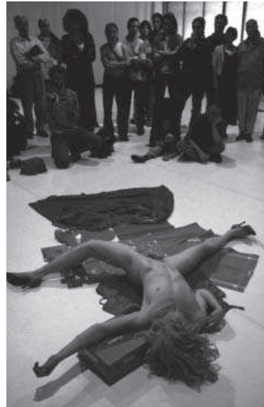
4. Another Bloody Mary , 2000.

“Por mi formación de bailarina intento ir a música, intento cortar el tomate y se me escapa. Se trata de encontrar una explicación diferente a la danza. Mi trabajo es un trabajo para la danza. Más que si es o no es, yo estoy para. Y en el vídeo se ven muchos detalles que cantan a bailarina, a bailarina de un-dos-tres, un-dos-tres... con el ajo de repente estoy siguiendo el ritmo y no lo hacía de manera consciente (...) me gusta mantener esa cosa que me hace ir a ritmo“. (La Ribot, 2003: 224).