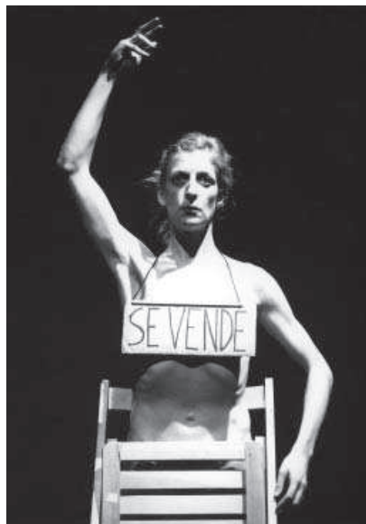
2. N. 14, 1997.

El humor impregna también esta serie y permite llevar a cabo un proceso de extrañamiento y disociación entre artista e intérprete que le conduce a comparar su cuerpo al de un pollo desplumado ( Sin título III ) o a arrastrar el cuerpo hasta la muerte, como en Manual de Uso (n. 20), una pieza tragicómica en la que el cuerpo se convierte en un aparato cuyas instrucciones de uso le conducen a la asfixia, o en N. 14 (n. 14) de carácter más violento. En esta última La Ribot se cuelga al cuello un cartel de cartón donde pone “Se Vende”, se encaja una silla de madera a la altura de la cintura y levanta un brazo en postura de ballet. Baja lentamente el brazo y de puntillas, mirando fijamente al público va caminando hacia atrás, se detiene y gira lentamente sobre sí misma hasta quedar de perfil y retroceder hasta el fondo de la sala donde dobla la silla contra su vientre de forma más violenta al tiempo que cae apoyada contra la pared hasta parar bruscamente y quedar tumbada y paralizada en el suelo 6 . Su fuerza plástica y performativa han convertido a esta pieza en uno de los iconos del proyecto.