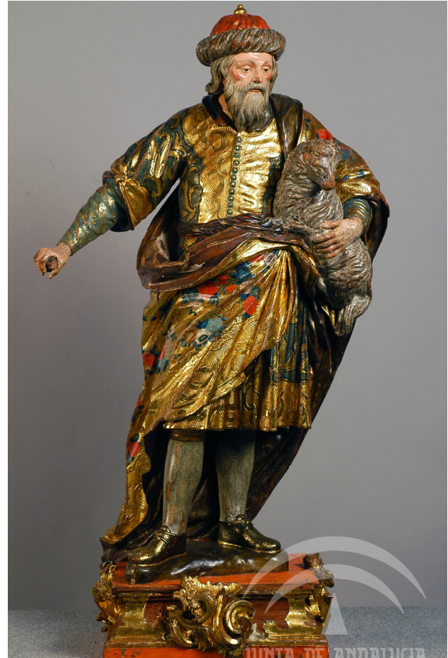
2. San Joaquín , retablo de Santa Ana del Salvador de Sevilla. Anónimo, 2.ª mitad del siglo XVIII

Con el número 20042 del museo hay una talla de San Joaquín catalogada como Anónimo , de finales del siglo XVIII (86x60x40) [1]. Está realizada en madera policromada y estofada, y representa a San Joaquín, el padre de la Virgen María, como un hombre anciano y barbado, está de pie aunque ligeramente inclinado hacia la derecha con la mano izquierda y porta un libro a la vez que se recoge el manto, vestido con túnica y manto de pliegues muy movidos y abultados.