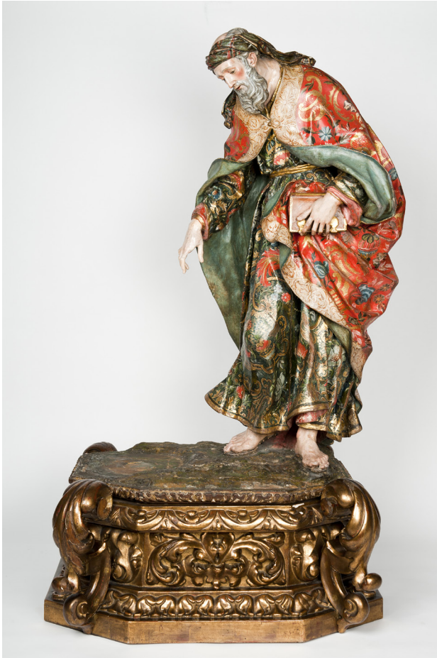
1. San Joaquín , 2.ª mitad del siglo XVIII, escuela sevillana. Museo Sorolla. N.º inv. 20042