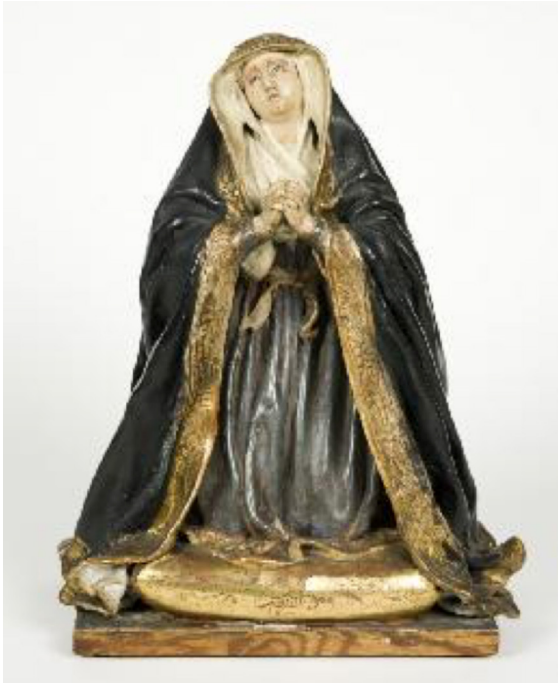
4. Dolorosa . Cristóbal Ramos. 2.ª mitad del siglo XVIII. Museo Sorolla. N.º inv. 20036

La imagen del Museo Sorolla, por su pequeño tamaño (33x27x21), podría ser un modelo para enseñar a los clientes o bien una imagen devocional de pequeño formato. En cuanto a la policromía de la imagen, es de colores lisos, azul-grisáceo en la túnica y azul oscuro en el manto solamente con una cenefa con la lazada y motivos de flores en dorado que alivian esa sensación de austeridad.