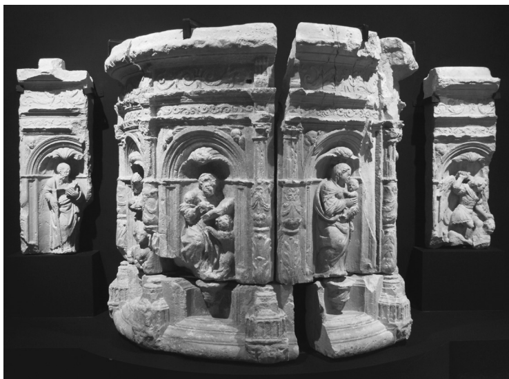
1. Pulpito

Poco a poco, a lo largo de la centuria del quinientos, los diferentes maestros que intervienen van introduciendo, aún manteniendo la unidad estilística del templo, el nuevo estilo renaciente, tanto en los motivos ornamentales como en la estructura arquitectónica.