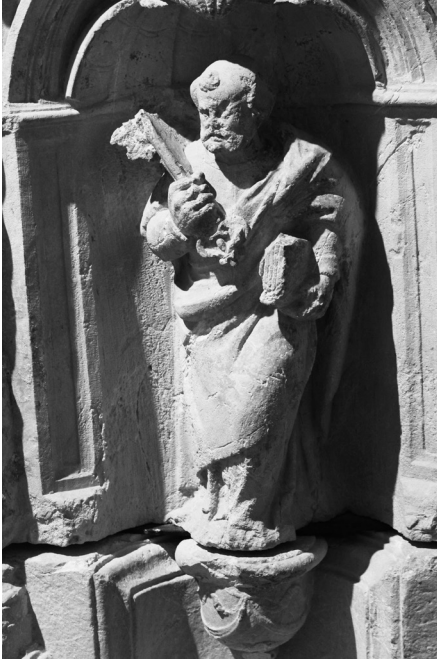
4. San Pedro