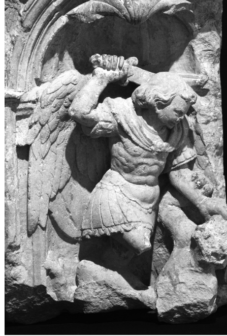
5. San Miguel

La figura de San Pedro, situada en la actualidad a la izquierda de la Virgen, presenta una iconografía fácilmente identificable. Hombre de edad avanzada, con acusada calvicie. Viste amplia túnica y manto. Con la mano izquierda sujeta un libro cerrado que apoya en su costado. En la mano derecha sostiene de manera ostensible una gran llave, su atributo más característico y constante. Mediante la llave se hace referencia al papel conferido por Cristo al príncipe de los apóstoles, simbolizando el poder de atar y desatar, de absolver y excomulgar. Aunque aquí San Pedro porta una única llave, normalmente son dos juntas porque el poder de abrir y de cerrar es uno sólo 13 [4].