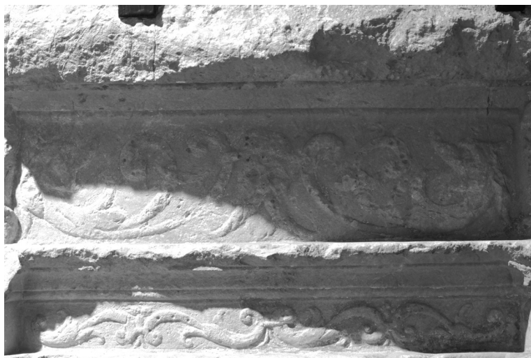
7. Friso de San Pedro

Creemos que estas figuras han de ponerse en relación con la de San Pablo. Este es considerado el apóstol de los gentiles, por lo que mediante estas figuras estaría haciendo relación a los pueblos bárbaros y las falsas religiones que profesaban que, al conocer la doctrina cristiana, abandonan los cultos erróneos. De ahí el carácter pacífico, tanto de los animales como del rostro humano, atraídos por la predicación de San Pablo a la verdadera religión cristiana.