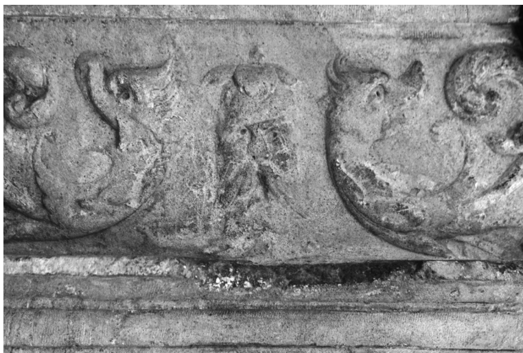
8. Friso de San Miguel

en la que se aprecia una calavera provista de alas, por medio de la cual se está haciendo referencia a la Resurrección, y a la que flanquea la imagen de la Virgen, que se corresponde con la cabeza de un león, símbolo de la vigilancia.