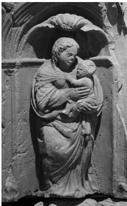
3. Virgen María con el Niño

La figura de María se halla cobijada bajo una venera, cuyo interior se encuentra más decorado que las de sus compañeros, con unas ondulaciones que recuerdan las ondas marinas, queriendo remarcar la importancia del motivo. Es sabido que en la época clásica, la venera era atributo de Venus. El cristianismo aprovecha el simbolismo del agua, y se transforma en elemento regenerador, alusivo al agua del bautismo, asimilándose en muchas ocasiones a la Virgen, como vehículo necesario para el nacimiento de Cristo. Aunque la venera se sitúa sobre todas las figuras, es sobre María donde cobra realmente mayor importancia y relevancia.