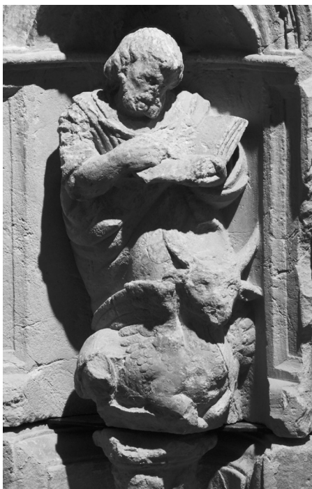
2. San Lucas