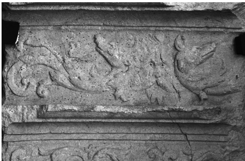
6. Friso de San Pablo

Sobre los arcos avenerados que cobijan las diferentes imágenes estudiadas, corre un friso, cuyos motivos ornamentales difieren en cada uno de los tramos. Así, mientras que en los que se sitúan sobre las figuras de la Virgen, San Lucas o San Marcos, la decoración se limita a estilizados roleos, los que coronan las imágenes de San Miguel, San Pedro y San Pablo presentan decoración diferenciada, que permite una interpretación iconográfica singularizada. Siguiendo el mismo orden de derecha a izquierda, llevado a cabo hasta ahora, comenzaremos el análisis por la figura de San Pablo, situada actualmente fuera del contexto del púlpito.