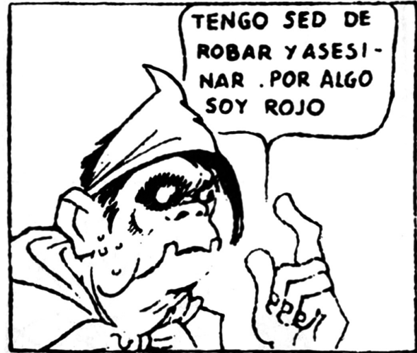
3. Título y primera viñeta de Un miliciano rojo (Fuente: MARTÍN, Antonio, Historia del cómic español... , p. 174)

tra un concepto puede oponer otro en una discusión crítica, y puede rechazar el que se le ofrece. Lo eficaz es hacer vivir a los otros cualquier tipo de experiencia 31 .