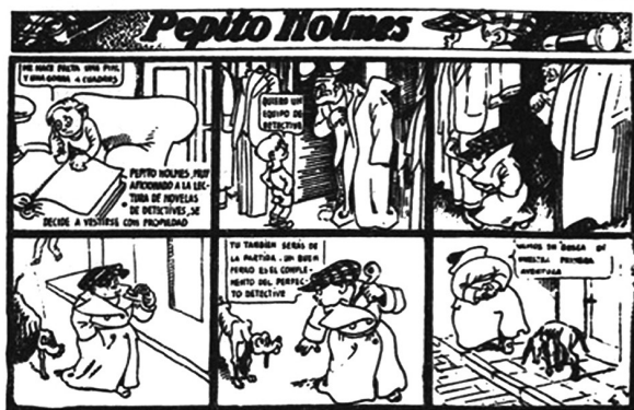
2. «Pepito Holmes» en la revista Chicos (Fuente: MARTÍN, Antonio, Historia del cómic español... , p. 212)

del lenguaje junto a una elaboración artística de gran funcionalidad 22 . Además, es en las historietas y portadas diseñadas para Pelayos [1] donde podemos observar cómo el autor ponía de manifiesto un maniqueísmo personal que convertía su obra en un arma con una gran capacidad de propaganda al servicio del bando alzado 23 , debido a la repetición constante de estereotipos y consignas ideológicas que hacían que los lectores infantiles las absorbiesen de una forma totalmente eficaz, motivo por el que es tremendamente comprensible la afirmación: «[...] la virulencia de los ataques es aún mayor en los tebeos del bando rebelde. Sus publicaciones impresas sobre todo en San Sebastián