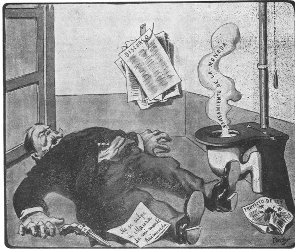
EL SUCIO DE VILLAVEJIDE