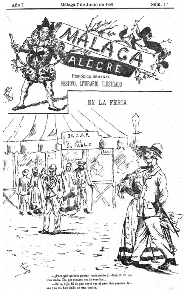
1. Verdugo Landi, Francisco y Ricardo, Málaga Alegre , año I, n.º 1, 7/6/1891, portada. Archivo Díaz de Escovar. Fundación Unicaja. Málaga

Tras estas primeras experiencias algunos de los hermanos Verdugo se marchan a Orán, en Argelia, que bajo la administración francesa se convirtió en sitio de peregrinaje de colonos europeos, muchos de ellos españoles, que implantaron su modelo cultural sobre la población entrante, como prueban las palabras de Guy de Maupassant que