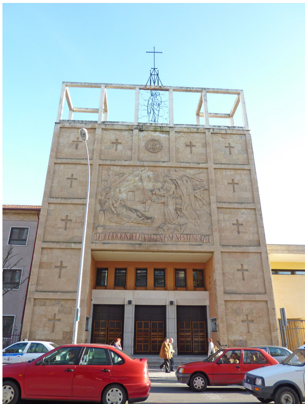
6. Fernando Población del Castillo, Iglesia del Barrio de la Prosperidad , 1952, Paseo de San Antonio

dad, llegando a afirmar que «consideramos trasnochados los equilibrios arquitectónicos antiguos, con pobres réplicas de la monumental arquitectura salmantina, como se observa en algunos edificios de reciente construcción» 15 .