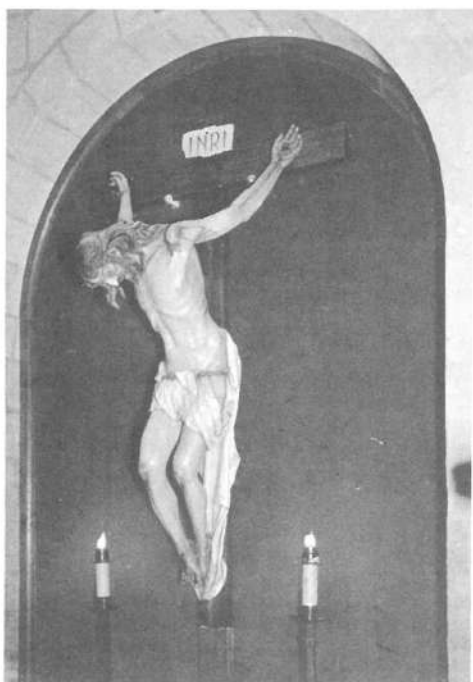
Cristo de la Noche Oscura. Ubeda (Jaén).