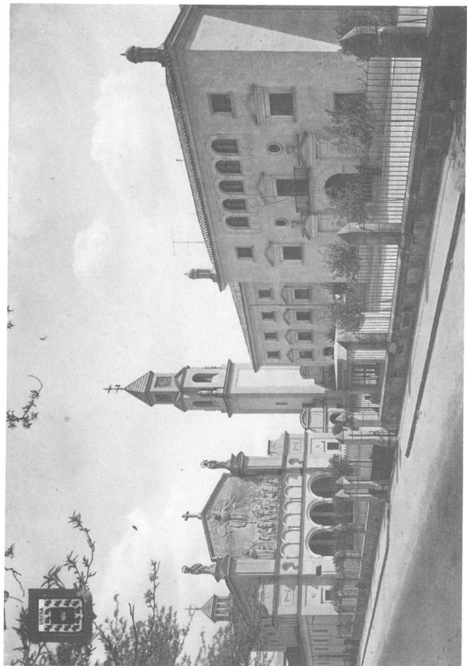
Escuelas de la Sagrada Familia y Templo de Cristo Rey. Ubeda (Jaén).