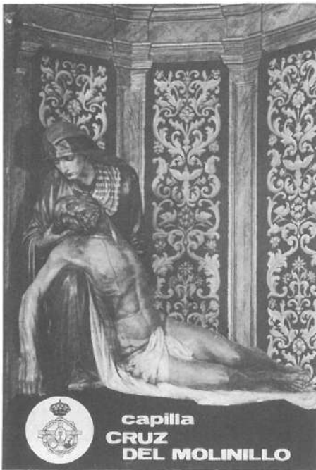
Real Hermandad de Nuestra Señora de la Piedad.