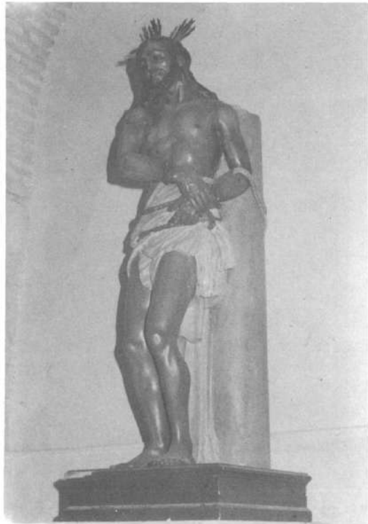
Jesús de la Humildad. Parroquia de San Pedro Apóstol. Torredonjimeno (Jaén).