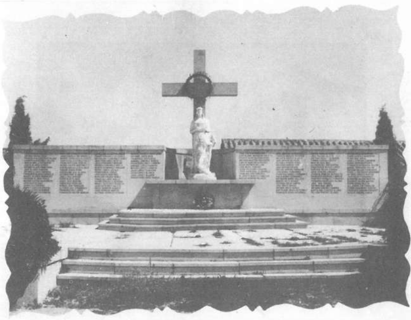
Monumento a los Caídos. Villanueva de Córdoba - 1939.