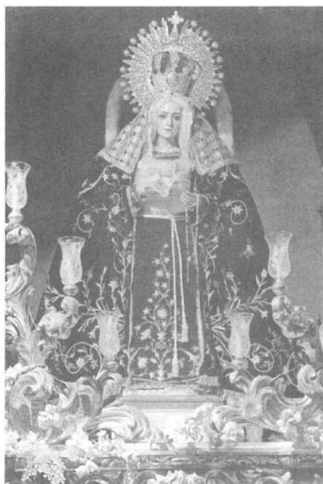
Nuestra Señora de los Dolores. Ubeda (Jaén).