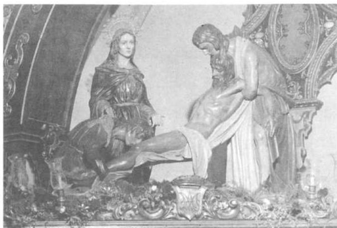
Santo Entierro de Cristo. Ubeda (Jaén).