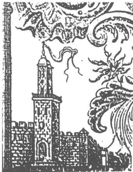
Lám. 4.— Libro de Hacienda Mayor 1770.