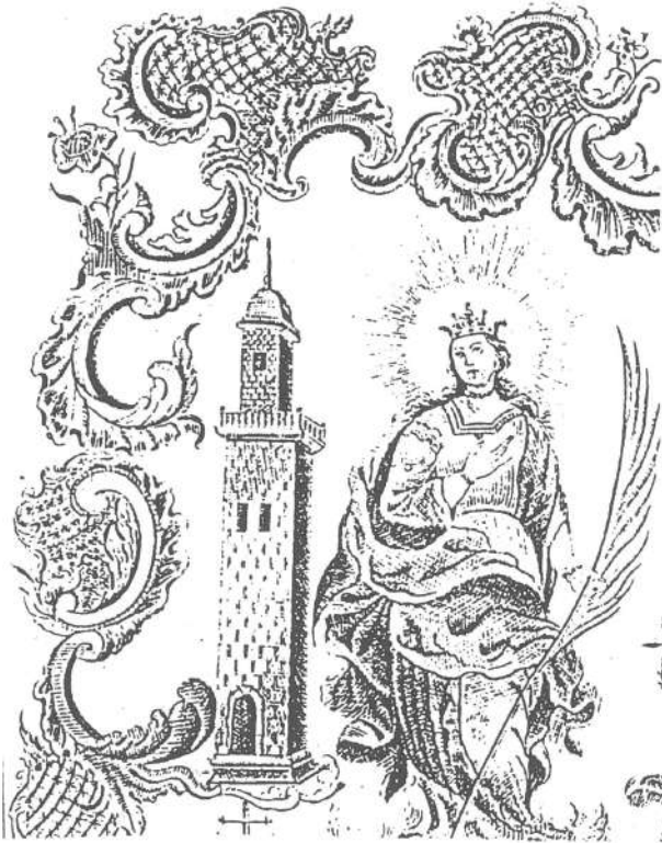
Lám. 3.— Protocolo Capilla Sta. Bárbara 1765.