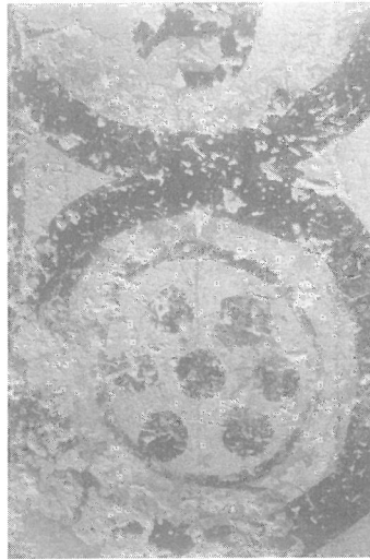
3. Dibujo preparatorio pintado, en color almagra, también en sentido horizontal.