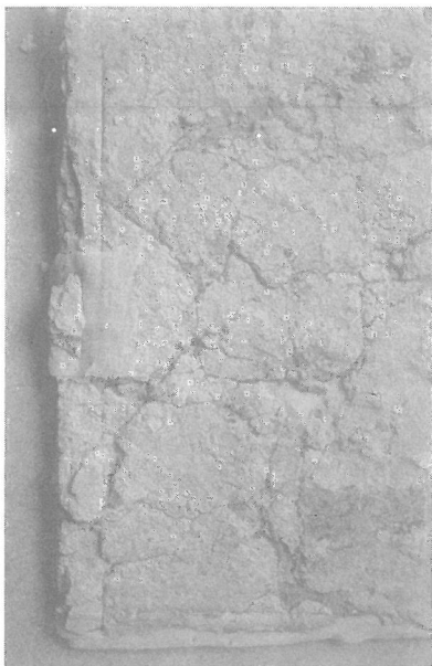
5. Durante la restauración, fue imprescindible realizar un arranque; por su parte posterior aparecieron cortes rectos de límite de las diferentes jornadas.