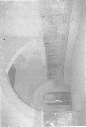
1. Vista general del Claustro de los Evangelistas, con el zócalo decorado.