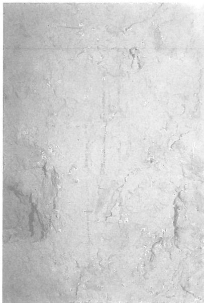
6. En ese mismo proceso, apareció en la capa subyacente dibujo preparatorio de la composición fundamental, a modo de 'sinopia', en almagre.