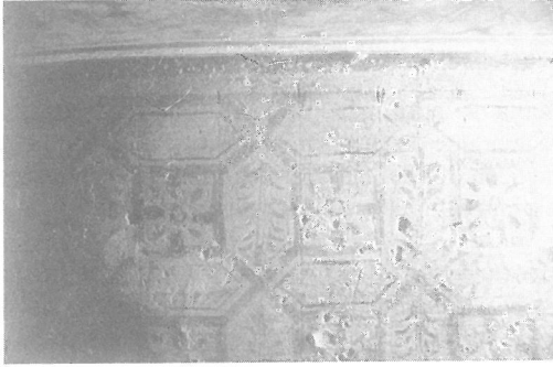
2. Dibujo preparatorio grabado, realizado con cuerda en tensión en sentido octogonal.