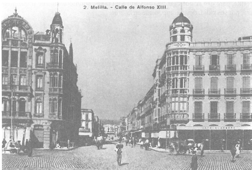
Lámina 2: Edificios n°1 (Arq: D. Enrique Nieto) y n°2 (Arq: D. Manuel Rivera Vera) de la calle Alfonso XIII -antes Chacel, actual Avda. Juan Carlos I- (col. Foto Soria, 1992, sn).