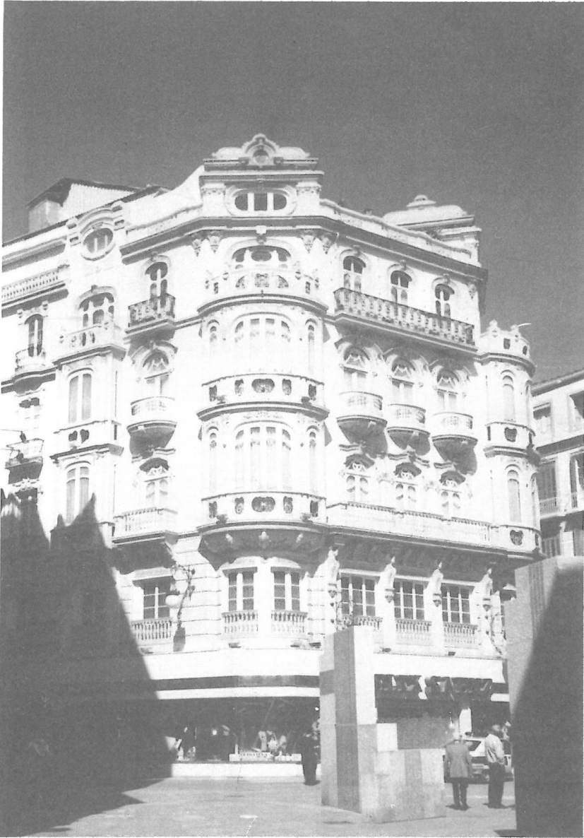
Lámina 5: Estado actual de los almacenes Félix Sáenz -Plaza Félix Sáenz-. Arquitecto: D. Manuel Rivera Vera.