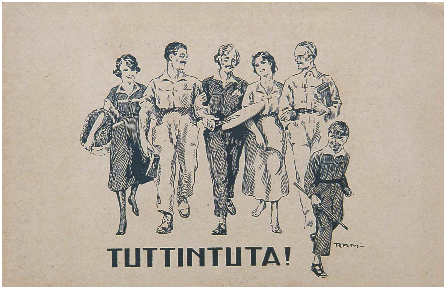
2. RAM, Tuttintuta! , Cartulina postal, 9 x 14,5 cm

carada inútil de la vanguardia (Pautasso, 2016: 77-80). Su hermano RAM (Roger Alfred Michahelles) dibujó una postal en la que aparecían tres hombres y un niño con el mono —el artista, el obrero y el escritor— acompañados por dos mujeres, una alegoría entre la democratización de la vestimenta y la transformación social [2].