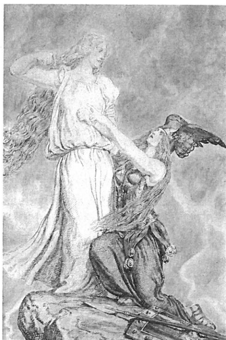
3.- Gutrune y Brunilda