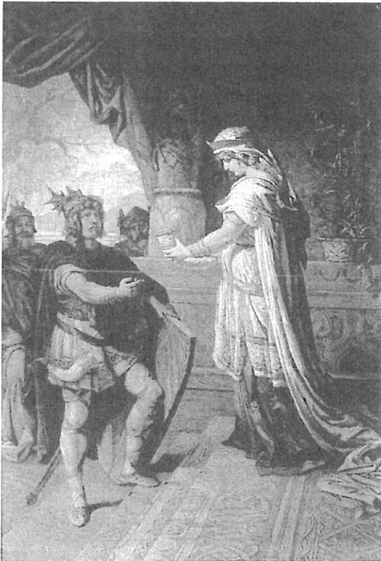
8.- Una escena de los Nibelungos. La ilustración Artística, 1884.