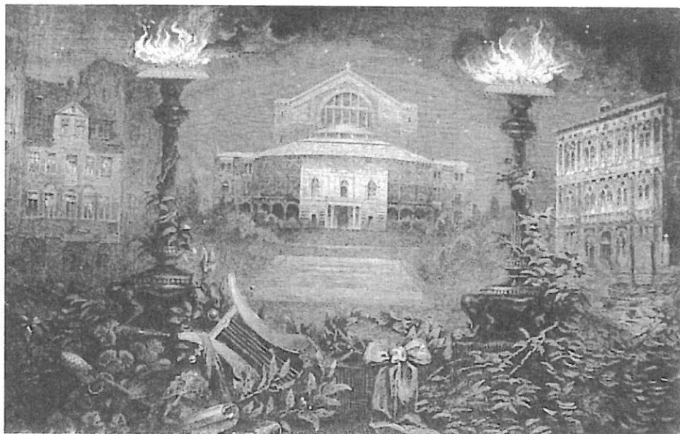
6.- Un recuerdo a Ricardo Wagner. La ilustración Ibérica, 1883.