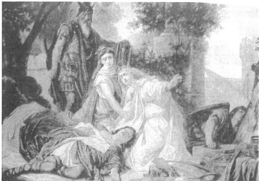
9.- Muerte de Tristán. La ilustración Artística, 1885.