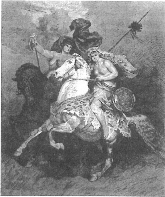
5.- Las amazonas. La ilustración Ibérica, 1881.