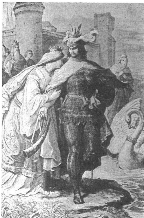
1.- La despedida de Lohengrin