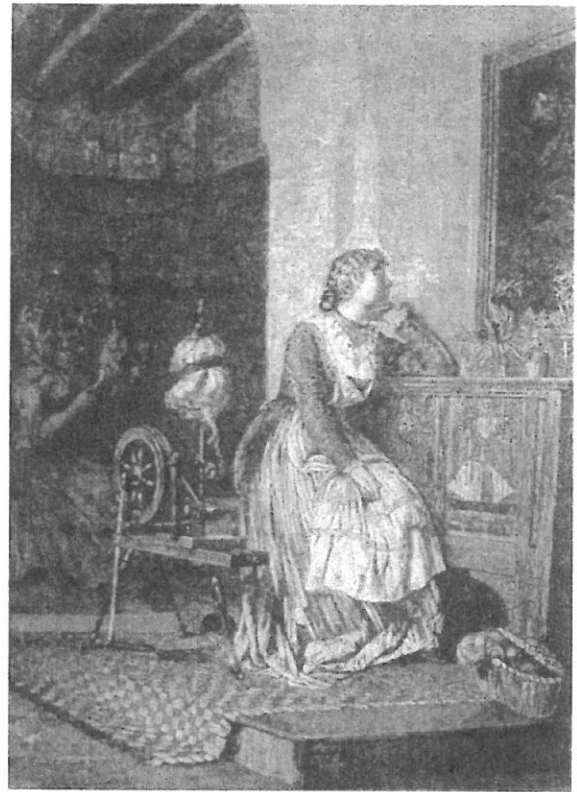
7.- Senta. La ilustración Ibérica, 1883