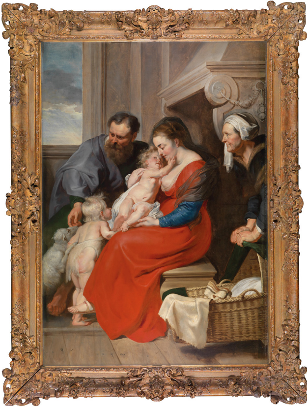
3. La Sagrada Familia , Rubens. 1615-1620. Colección particular. Óleo sobre lienzo, 221 x 152 cm