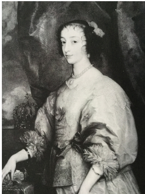
2. La reina Enriqueta María de Francia , Van Dyck, c. 1633. The Loyd Collection, Lockinge, Berkshire. Óleo sobre lienzo, 107.3 x 84.5 cm

borough se deshace de ellas por apuros económicos y son subastadas en la sala Christie's de Londres, el 31 de julio de 1886, siendo adquiridas por Robert Lloyd-Lindsay (1832-1901), Lord Wantage, a través del marchante de arte Agnews (Christie's, 1886: 60-61).