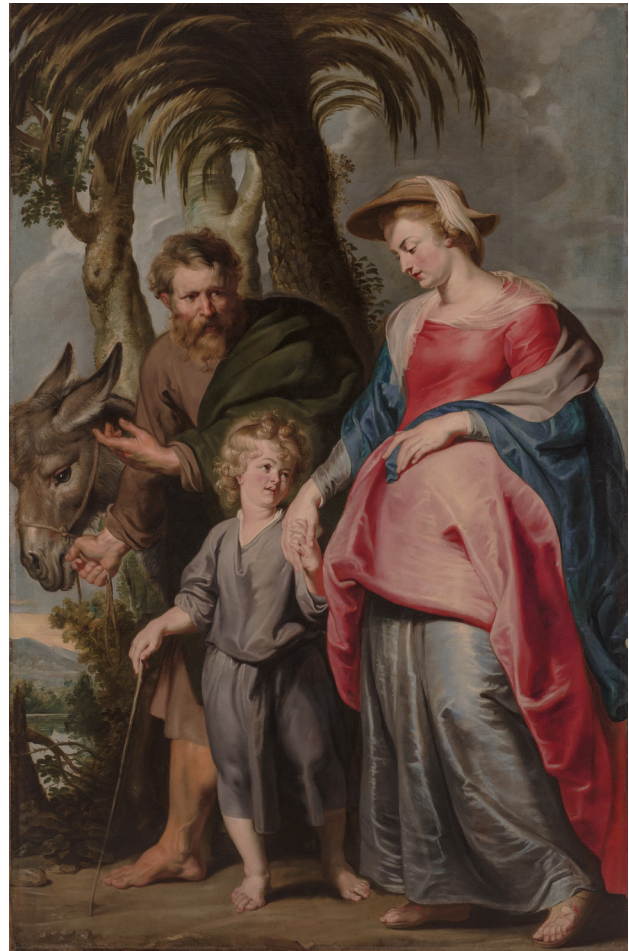
4. Regreso de la Sagrada Familia de la Huida a Egipto , Rubens 1615-1620. Colección Wadsworth Atheneum de Hartford, Connecticut. Óleo sobre lienzo, 231.5 x 153 cm