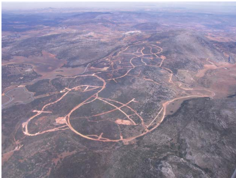
Foto Núm. 1. Foto aérea de los Merinos Norte tomada en enero de 2008.