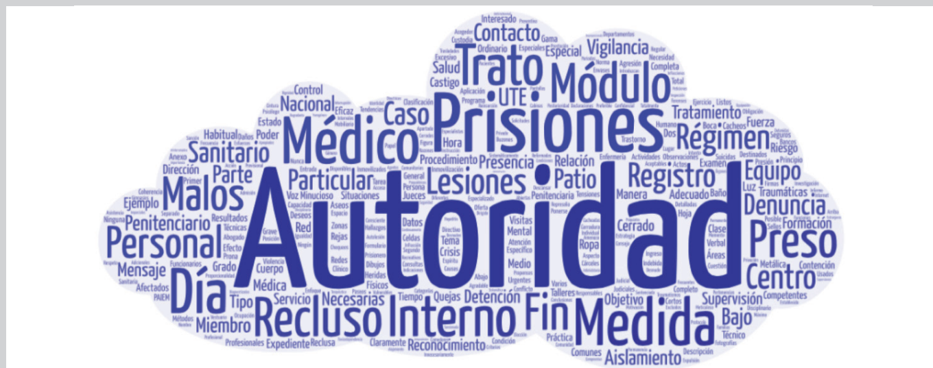
Figura 1. Nube de palabras a partir de las recomendaciones dirigidas a centros penitenciarios

desestimadas, invitaban a incrementar las visitas abiertas y a expandir los medios disponibles para que los reclusos extranjeros pudieran comunicarse con sus allegados.