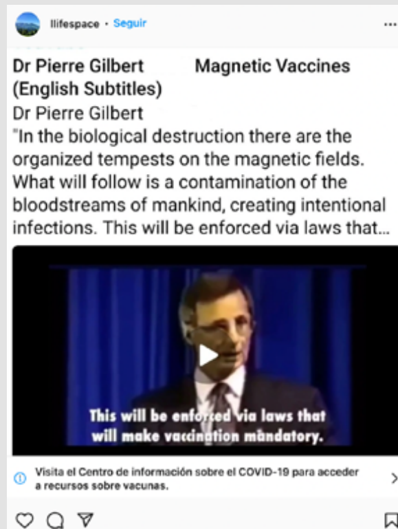
Ilustración 1. Captura de pantalla del perfil de @lifespace de Instagram. 2021

El problema de este tipo de campañas es que impactan en la sociedad y un tanto por ciento de la población llega a creerse este tipo de noticias, lo que supone no atender a las recomendaciones de las autoridades sanitarias y una disminución del número de ciudadanos que no quieren vacunarse, y como consecuencia, supone un ataque al bien jurídico integridad física, vida y salud pública principalmente, por los efectos negativos que supone la aceptación de todos estos mensajes manipulados sobre la campaña de vacunación de la COVID-19, como se muestra en la imagen a continuación: