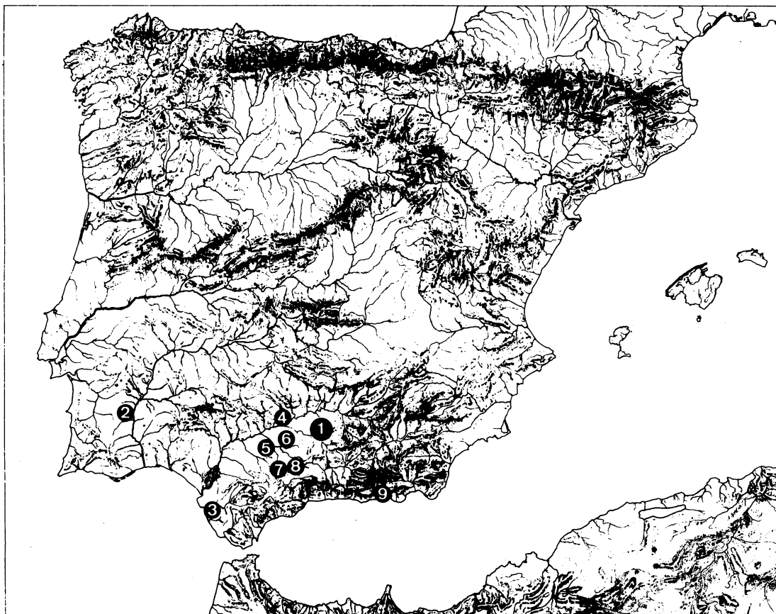
FIG. 1.—Localidades donde se documenta la existencia de hermes-retratos. 1: Porcuna (Jaén); 2: Beja (Portugal); 3: Cádiz; 4: Córdoba; 5: Ecija (Sevilla); 6: Osuna (Sevilla); 7: Campillos (Málaga); 8: Bobadilla (Málaga); 9: Adra (Almería).

Campillos (7), uno en Bobadilla (8) y uno (posible) de Adra (9) (Fig. 1).