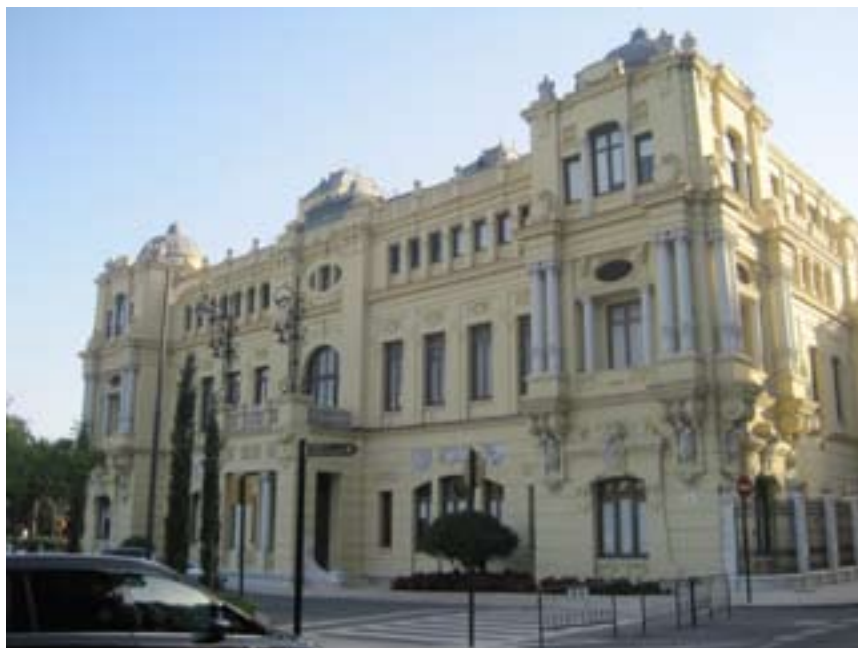
FIGURA N° 3 FACHADA ESTE DEL AYUNTAMIENTO (MÁLAGA)

cional de espacios claustrales, los tribunales de justicia y los parlamentos se conciben con voluntad de ser emblemas urbanos y símbolos del poder civil. Entendido como templo de la democracia, el parlamento de Londres (1837-1843) es un claro ejemplo de edificio historicista. Las sedes parlamentarias cuentan con ejemplos señeros en toda Europa y en toda América (el Reichstag de Berlín es uno de ellos).