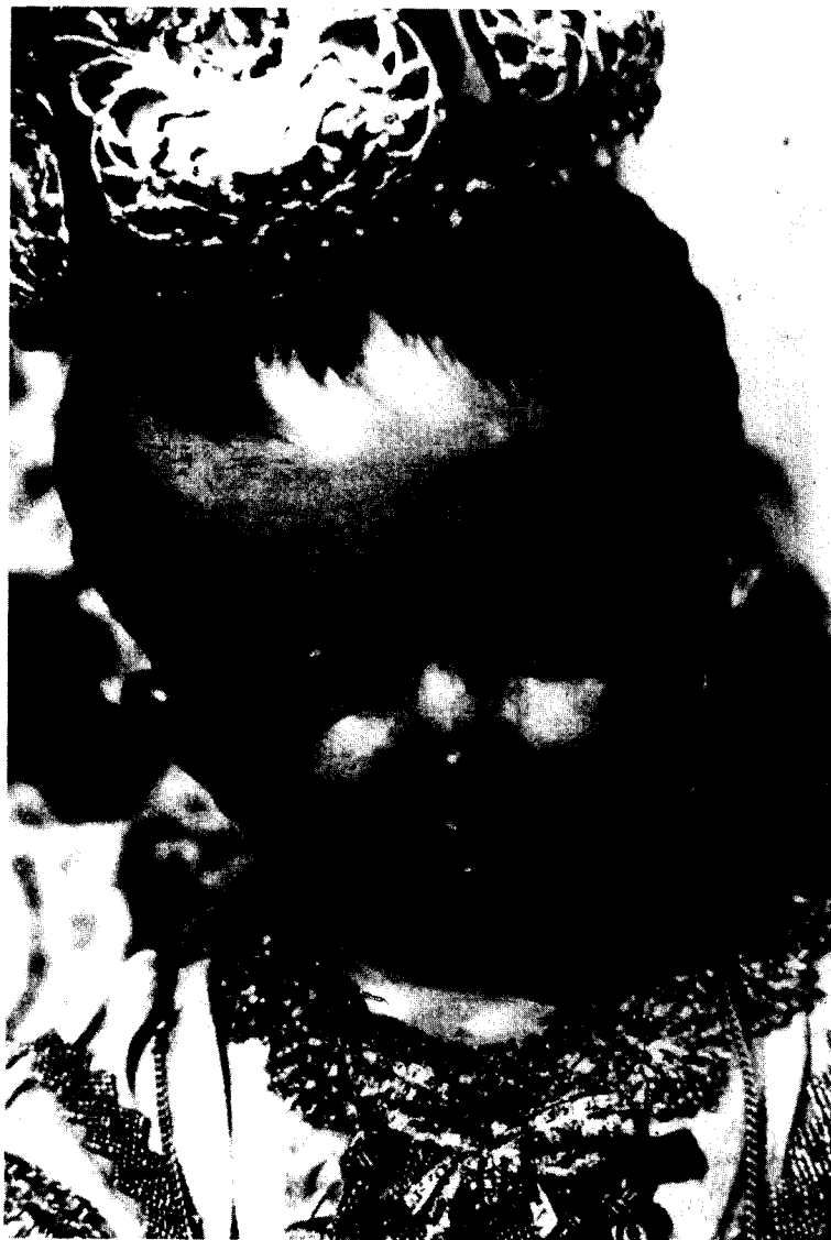
5.- NIÑO DEL ROSARIO (detalle de la cabeza). Entre 1755-1795.