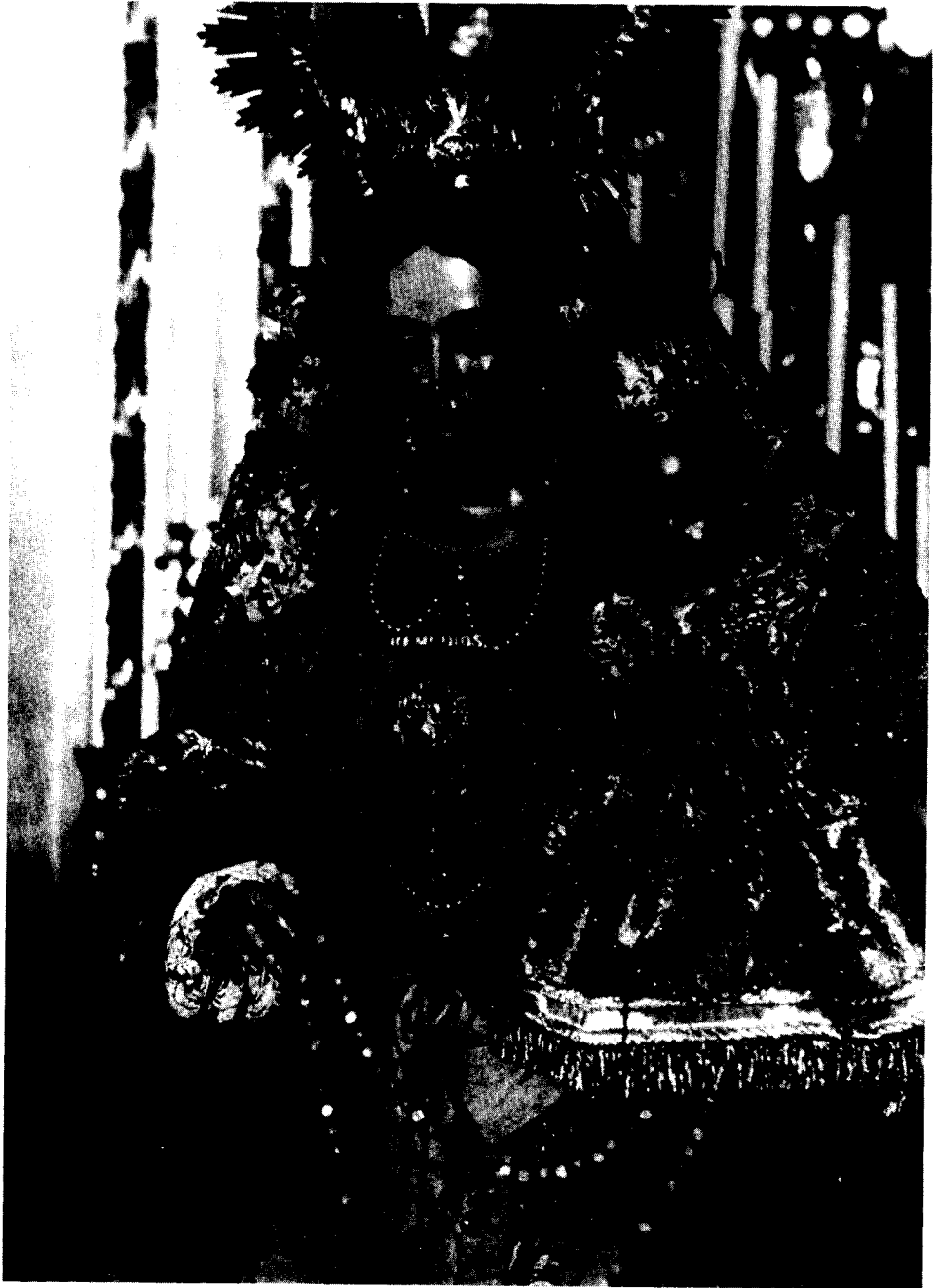
3.- VIRGEN DE LOS REMEDIOS y NIÑO DEL ROSARIO: Anónimo (h. 1755-1795).