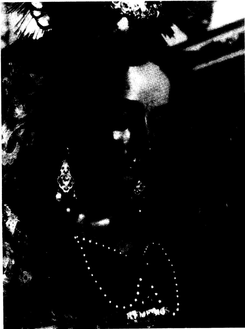
4.- VIRGEN DE LOS REMEDIO (detalle de la cabeza). Entre 1755-1795.