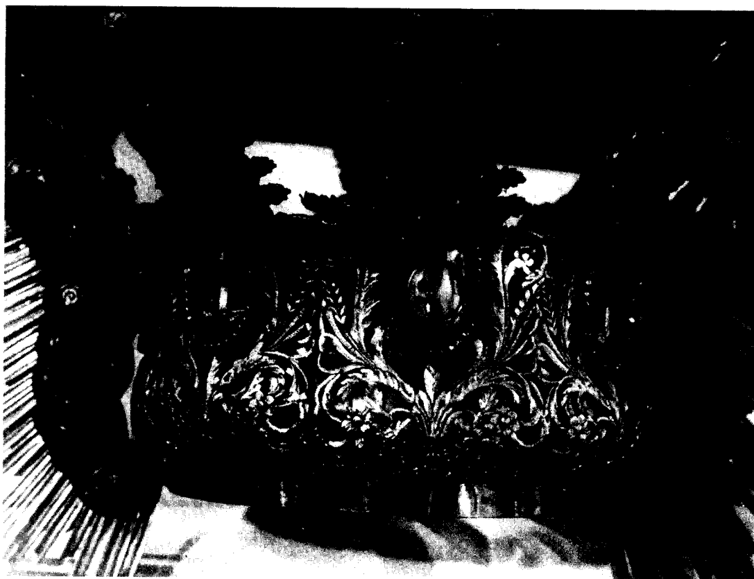
7.- CORONA (DETALLE): Manuel Marín. Finales del siglo XVIII. Hermandad de los Remedios. Los atributos de la LETANIA LAURETANA que aparecen en la ilustración son, de izquierda a derecha, el PILAR, la LUNA y el CEDRO.