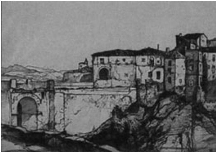
1. Old houses at Ronda ; Oliver Hall, pp. S. XX, colección particular, Londres.

Volviendo a la imagen en sí, se trata del grabado titulado Viejas casas en Ronda 12 ( Fig. 1 ), donde Hall nos mostró una estampa donde el puente y su cercano ambiente urbano y paisajístico son los protagonistas, concediendo un papel primordial a la pintoresca apariencia de las edificaciones, que junto al puente, se asoman a la garganta del Tajo. La imagen está tomada desde el lado de la garganta situado en el barrio del Mercadillo, y nos muestra la primera impresión urbana que desde aquí –justo al borde de la cornisa, que aparece en primer término en el ángulo inferior izquierdo– se tenía, y en parte aún se tiene, del barrio antiguo de Ronda, la Ciudad, que ocupa la parte derecha de la imagen. A la izquierda aparece el segmento superior del Puente Nuevo que da acceso al citado barrio y el fondo paisajístico que le sirve de marco. Un grabado al aguafuerte, que enlaza perfectamente con la más finisecular de las tradiciones paisajísticas del romanticismo y el placer decimonónico del viajero inglés por Andalucía, donde Hall plasmó a la perfección la belleza existente en el contraste entre lo monumental, lo popular y el paisaje que en este punto del tejido urbano de Ronda se dan cita. Escena en la que Hall nos ofreció una admirable síntesis de los atractivos que la ciudad ofrece al viajero y al artista, mostrándonos una estampa cuya originalidad reside en no quedarse en la clásica vista frontal del Puente Nuevo.