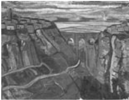
25. El Tajo ; Jesús González de la Torre, óleo sobre lienzo, 73 x 92 cm., 1956.

Con el óleo de González de Torre damos por finalizado nuestro escueto recorrido por la historia visual del icono monumental. Una historia en los entornos del siglo XX que, a partir de la década de los ochenta, dio paso a una nueva era en el ámbito de la imagen plástica del monumento. Pues desde entonces, y al amparo de novedosas y agresivas políticas de consumo, la singular estampa del sublime puente ha pasado de reclamo artístico a objeto de consumo turístico, perdiendo –en la práctica totalidad de casos– las bonanzas estéticas que otrora la identificaban en beneficio de la más pura estética kitsch . Hoy día, son cientos los ejemplos de objetos que incorporan la imagen del Puente Nuevo de Ronda como reclamo para su compra por parte del turista de folleto y prisa; entre ellos, poco espacio hay para el arte, que pareciera haberse ocultado avergonzado ante tal avalancha globalizante y empobrecedora. No obstante, siempre hay lugar a la excepción y a la ruptura de tendencias, y así, nos felicitamos por poder terminar este pequeño artículo con uno de los últimos óleos del sevillano Cristóbal Aguilar, que aún hoy es capaz plasmar con sus pinceles la sublime y mágica belleza del Puente Nuevo entre las paredes del Tajo ( Fig. 26 ).