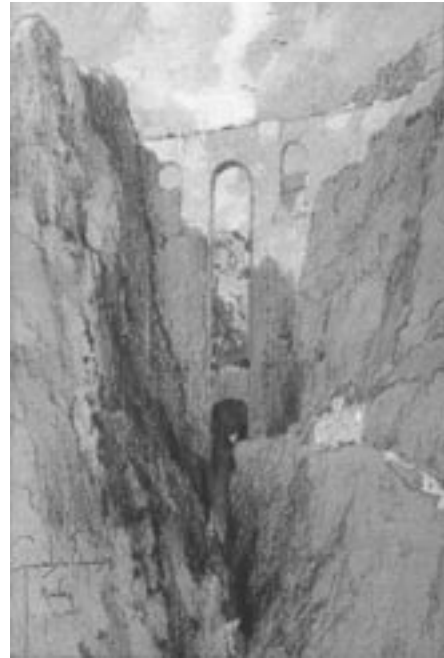
3. The chasm of Tago and the Bridge of Ronda; Georges Wharton Edwards, 1925, colección particular.