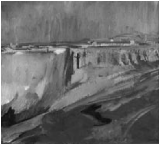
5. Ronda; David Bomberg, 1935, Galería Marlborough, Londres.

imagen de marcado tono naturalista, que si bien no contiene los rasgos definitivos románticos, tampoco se aparta de una estética que podríamos definir como tipológica respecto al tratamiento que los viajeros extranjeros han dado al monumento. Lo único que incluye el autor como rasgo de modernidad es el propio ambiente urbano, mucho más animado y tecnificado a través de la aparentemente irrelevante aparición de las farolas de luz eléctrica prendidas de los pretilos del puente, pues su comparación con las imágenes de corte impresionista ya tratadas nada nos ofrece a este respecto. Sin embargo, es una de las imágenes que mejor traduce uno de los atractivos fundamentales de Ronda; su luminosidad y la claridad de su atmósfera. Luz de la que Gertrude Helena Bone – la poetisa inglesa esposa de Muirhead Bone que escribió los textos que acompañaron los dos volúmenes de dibujos de su marido – decía que “...parece contraer las distancias del paisaje español. Distancia y espacio [que] son cualidades que la imaginación tiene que procurar absorber en este país” 17 .