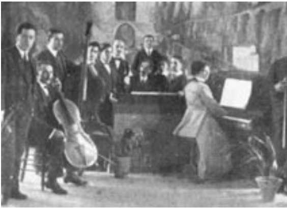
15. Debut de la Filarmónica Rondeña en el Teatro Espinel con el Puente Nuevo como telón de fondo; Ronda, 1916.

iconográfico del motivo y el nivel de representación ciudadana que este monumento tenía; pues de la imagen en sí poco podemos decir, ya que en la fotografía existente no se llega a ver completa. Pese a todo, y a tenor de la fracción que podemos ver, la imagen no parece tener una gran importancia plástica dada la planitud y errores perspectivísticos que presenta, los que, por otro lado, serían inherentes a su tamaño y al hecho de ser una obra que no pretendería perdurar en el tiempo, pues nació para cumplir un fin concreto y específico que no buscaría en ningún momento hacer de ella una gran obra de arte.