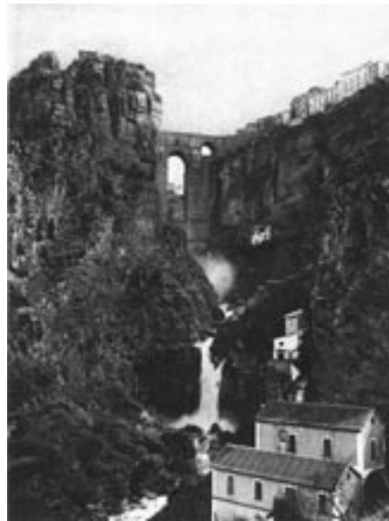
9. Ronda; Kurt Hielscher, h. 1920

Ronda, colocada en medio del extenso círculo de montañas de una altiplanicie, es de las ciudades más extrañamente situadas. En el inmenso patio rodeado de