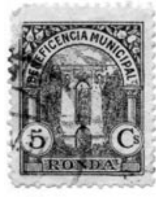
16. Puente Nuevo; sello postal, c. 1940, colección privada, Ronda.

También alejada de los fines puramente artísticos es la última de las imágenes que vamos a citar. Se trata de un sello postal de hacia 1940 ( Fig. 16 ), cuya finalidad era recaudar fondos a través de su venta para la beneficencia local. De autor anónimo y realizada aparentemente bajo una técnica xilográfica, su interés artístico es prácticamente nulo dada su falta de intencionalidad artística, su reducido tamaño y consiguiente falta de detalle. Su verdadero interés es histórico e iconográfico. Gracias a métodos representativos como éste, con un alto nivel de difusión que traspasa fronteras, el Puente Nuevo de Ronda ha llegado a ser un icono reconocido internacionalmente. Por otro lado, e incidiendo en el significado que el monumento tuvo y tiene para su ciudad, el solo hecho de escoger nuestro puente como imagen para un sello, evidencia que hacia 1940 ya era el principal icono visual de la ciudad. Una anécdota postal nos servirá muy bien para explicar tal extremo; se dice que hubo una carta franqueada en un país extranjero que llegó a su destino en Ronda con el nombre de su receptor y un pequeño dibujo del Puente Nuevo como únicos datos, ni uno más, pues todos los carteros que la vieron supieron gracias al dibujo a donde se dirigía.