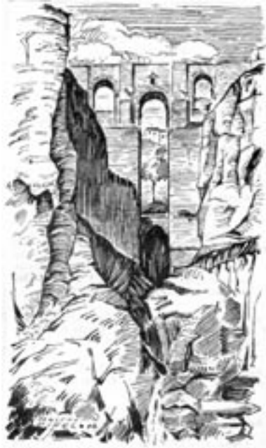
7. Puente Nuevo ; Rostei Pinel, 1948, Biblioteca Cánovas del Castillo, Málaga.

puntos de vista no son novedosos, pero sí la aplicación del trazo y el color, que destacan sobre todo en el óleo que el inglés firmó en 1935, cuya libertad de elección cromática, frescura y sutil luminosidad se unen a una expresividad situada a medio camino entre las grandes obras post-impresionistas y la belleza del paisaje romántico; una obra que reúne todos los requisitos para considerarla capital dentro de su género y de la producción del artista.