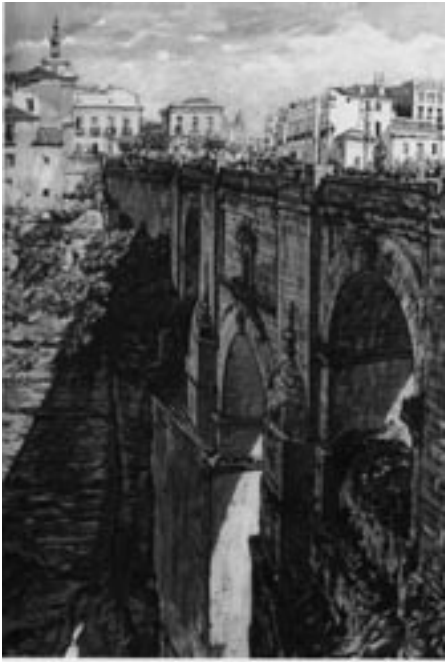
4. Puente Nuevo; Muirhead Bone, 1929, colección particular.

do por Gertrude Helena y Muirhead Bone. Los Bone fueron un matrimonio escocés que dedicó parte de sus esfuerzos productivos a escribir e ilustrar dos libros de viaje por España 15 , en los que Gertrude narró y Muirhead ilustró lo que observaron en nuestro país durante el año 1929.