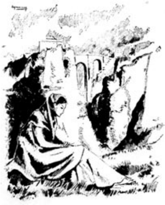
24. Sin Título ; Ramón de Capmany, c. 1971.

y el número monográfico – donde apareció dedicado a Ronda, y en especial a sus toreros –llevaba por título Ronda a un torero 39 . Pero, a diferencia de la imagen de Ruiz Rodríguez, ésta es todo un alarde entre romántico y simbólico; bello y singular, ejemplo de un paisajismo renovado, donde las sensaciones estéticas y sensoriales de sublimidad y melancolía se dan la mano en una armonía a la vez causada y compartida. Una síntesis provocada por la figura femenina, que a los pies del Tajo, protagoniza, junto a nuestro monumental puente, una escena llena de complicidad, donde el paisaje cumple a la perfección una función sensitiva,