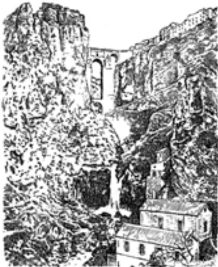
8. Tajo de Ronda; anónimo, c. 1928.

hasta 150 metros de profundidad. 23 La imagen ( Fig. 8 ), de autor anónimo, no presenta demasiada elaboración, siguiendo al pie de la letra los cánones naturalistas que realzan la esencia pintoresca, sublime y dramática del entorno y la construcción, sin apartarse de los parámetros románticos. Quizás lo más interesante de la imagen sea la inclusión de una vista de los molinos que existían a los pies del Tajo. Pero no es una vista original de éstos, pues como ya venía ocurriendo desde finales del siglo XIX, esta xilografía anónima no es más que la copia de una fotografía preexistente, pero, eso sí, una magnífica fotografía, que de ese modo abandonaba un bajo nivel de difusión para incorporarse a una obra de pretensiones mucho más amplias. Se trata de una de las fotografías que el alemán Kurt Hielscher tomó de Ronda a principios de los años 20, que se incluyó en su obra España inédita en fotografías. Costumbres, arte y tradiciones 24 con el título de Ronda ( Fig. 9 ), acompañada de las palabras que siguen, dedicadas por el alemán a la ciudad de Ronda: