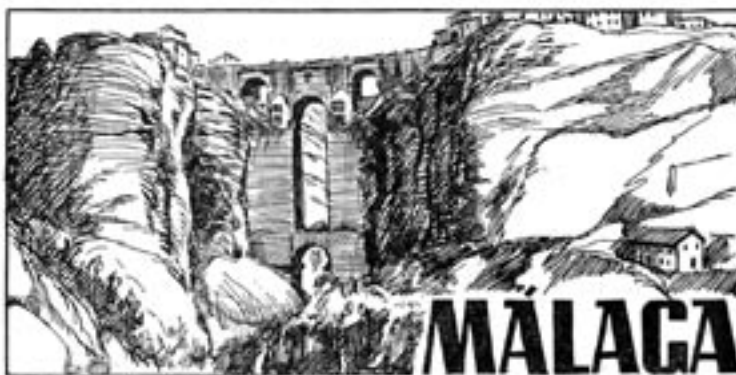
10. Sin título (Ronda – Puente Nuevo y Tajo); Manuel Huete, c.1950.

De similar origen y finalidad es la imagen de Manuel Huete ( Fig. 10 ) que ilustró Viajando por España de Antonio J. Onieva 26 ; que como curiosidad, a pesar de contar con la ilustración referida, no hace ni la más mínima mención literaria a Ronda o su Puente Nuevo. Ejecutada hacia 1950, es una litografía donde el Puente Nuevo y el Tajo vuelven a compartir el protagonismo que los ha unido a lo largo de toda la historia gráfica que aquí mostramos. De trazo nítido y expresivo, la imagen incluye las típicas casas colgantes, y adopta un punto de vista muy en la línea de la tradición romántica, sin alardes, pero dejando manifiesta huella de la espectacularidad de la escena.