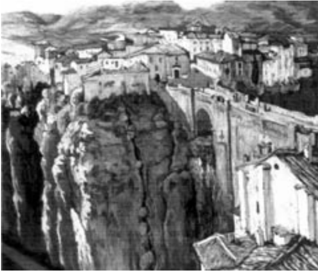
13. Puente Nuevo y vista de Ronda; Santiago Téllez Loriguillo, c. 1940.

tomó desde una de las azoteas o ventanas altas que en el barrio del Mercadillo dan vista al puente, el Tajo y el barrio de la Ciudad. Es una imagen novedosa por el encuadre urbano que nos ofrece, quizás no tan arriesgada como algunas que hemos visto hasta ahora, pero dentro de una línea renovadora dentro de la plástica nacional; será el trazo amplio y gestual cargado de masa pictórica, la luz y el contraste, el magnífico relieve creado por las nítidas líneas que estructuran volúmenes y la aplicación del blanco de los edificios, y una lograda texturación, los que contribuyan a hacer de este óleo algo diferente a lo normal.