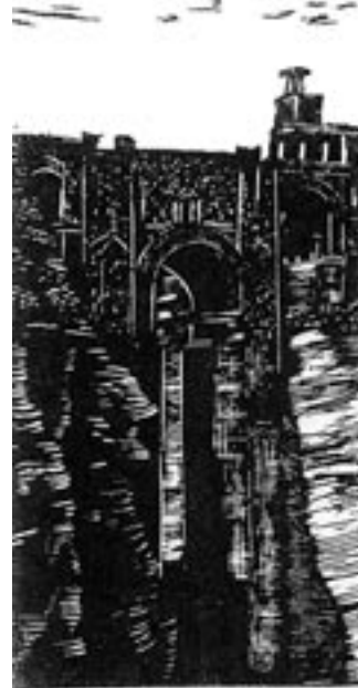
6. Puente Nuevo; David Bomberg, 1935, colección particular.