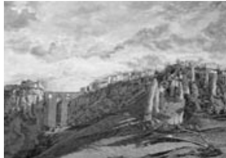
26. Puente ; Cristóbal Aguilar, óleo sobre lienzo, 81 x 60 cm., 2002.