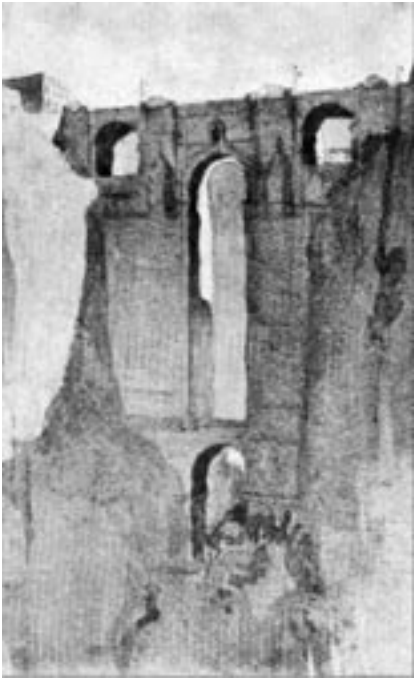
2. Puente Nuevo; Tha-Tun, h. 1920, colección particular.

Tras Hall, será un arquitecto indostánico llamado Tha-Tun quien, en torno al año 1920, plasmó el Puente Nuevo de Ronda en una acuarela ejecutada durante la visita monumental que realizó a la ciudad de la mano de la fundación internacional Architecture Association 13 ( Fig. 2 ). Ahora será la pura monumentalidad y el colosalismo del monumento los que llevarán el peso de la imagen; una imagen que a diferencia de la anterior está menos elaborada, y que por poco no pasa de ser un simple esbozo. Sin embargo refleja varios aspectos interesantes. Es una de las primeras acuarelas “antiguas” que se conocen del Puente Nuevo, demuestra –a través de la profesión de su autor y el motivo de su visita– que el puente atesora un interés técnico que se suma a la tradicional visión que hace residir su llamativo encanto en su ubicación pintoresca y sublime, y renueva el lenguaje plástico utilizado hasta la fecha, manifestando una apertura a movimientos como el impresionista; evidente en el tratamiento dado a la luz, al claroscuro o en el esquematismo otorgado a la propia estructura monumental.