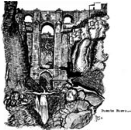
22. Puente Nuevo; Rafael Ruiz Rodríguez, 1952.

Una de las primeras ilustraciones del periodo la firmó en 1952 Rafael Ruiz Rodríguez ( Fig. 22 ), autor de Crónica histórico-descriptiva de Ronda 36 ; obra donde aparece la misma, que nunca llegó a publicarse y que se conserva en forma de manuscrito en el malagueño Archivo Temboury. Se trata de una plu-