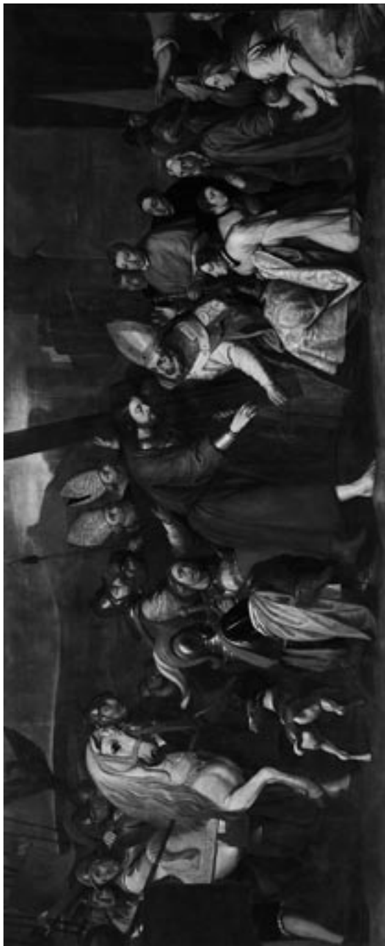
Aspecto general de la obra tras la restauración