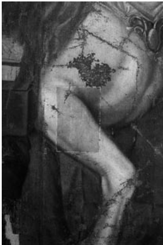
Cata de limpieza de la superficie pictórica