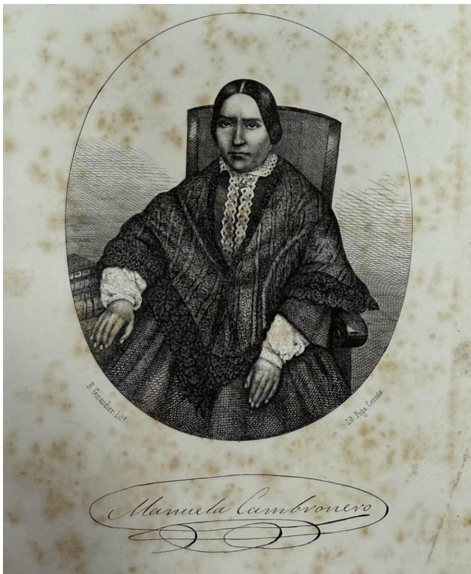
Ilustración 1: Litografía (Biblioteca Xeral de la USC, signatura: GA 45768)

el eclesiástico, que ratifican la noticia de su fallecimiento en la prensa, además de arrojar más información sobre la hora de la muerte o el cementerio en el que fue enterrada.