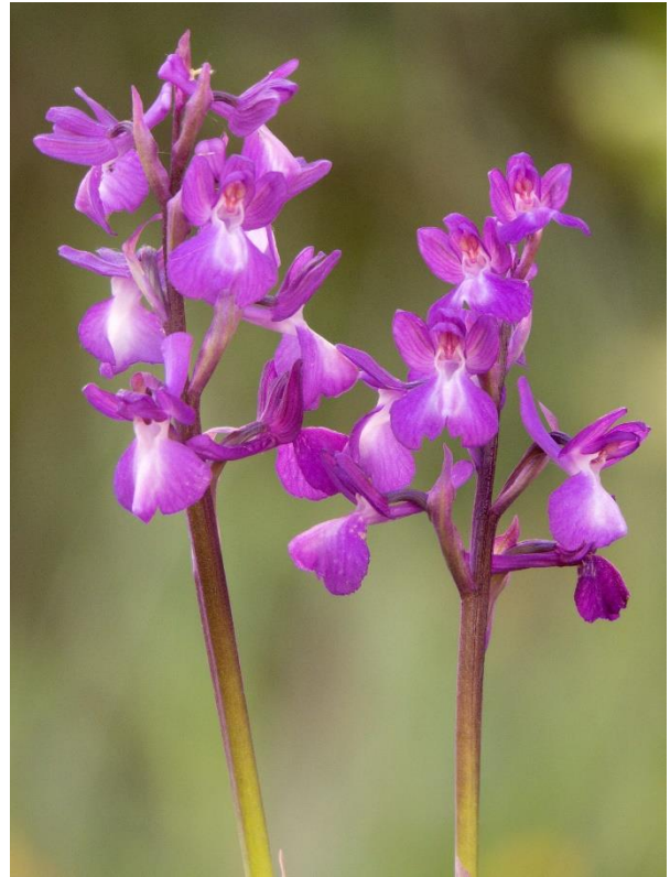
Figura 1. Anacamptis x rayyana .

ápice bífido a subbífido; relación longitud espolón/longitud labelo = 1,8-1,71.