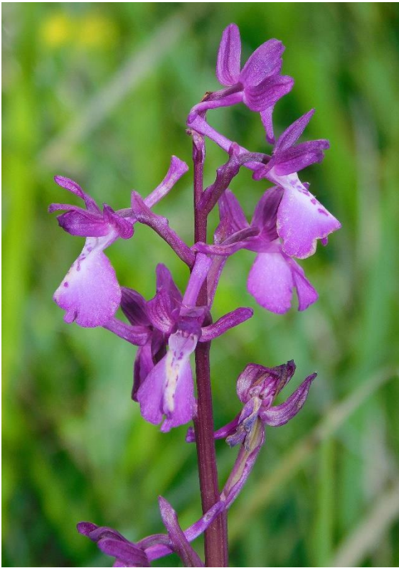
Figura 3. Anacamptis x alata .