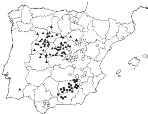
Figura 1. Área de distribución de: ▲ : Centaurea aristata ; ■ : Centaurea castellanoides subsp. castellanoides ; ○: Centaurea castellanoides subsp. talaverae ; □: Centaurea castellanoides subsp. arundana .

Observaciones: De todos los táxones del grupo C. paniculata con representación en el territorio, C. cordubensis Font Quer, C. bethurica E. López & Devesa y C. castellanoides son los únicos que presentan aquenios más o menos obovoide-obcónicos y ennegrecidos en la madurez, pero mientras que los dos primeros presenta el apéndice de las brácteas involucrales con una espina de 1,5-4(5) mm, claramente mayor que las fimbrias laterales, en el tercero culmina en un mucrón o arista de 0,3-1,5 mm, menor que estas (López & Devesa, 2008a). Además, C. cordubensis y C. bethurica habitan en el cuadrante SW de la Península, con claras apetencias por los substratos silíceos, mientras que C. castellanoides es calcícola y su área se extiende por el S y E de España.