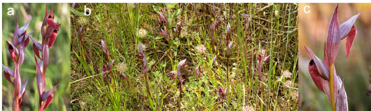
Figura 2. a) Pies de S. vomeracea . b) Vista general. c) Detalle de flores donde puede observarse la abundante pilosidad.

punto, aunque algo alejadas sí aparecen otras especies como Orchis langei K. Richt., Ophrys apifera Huds., Orchis italica Poir., Orchis champagneuxii Barnéoud, Ophrys ficalhoana J.A. Guim. y Ophrys tenthredinifera Willd.