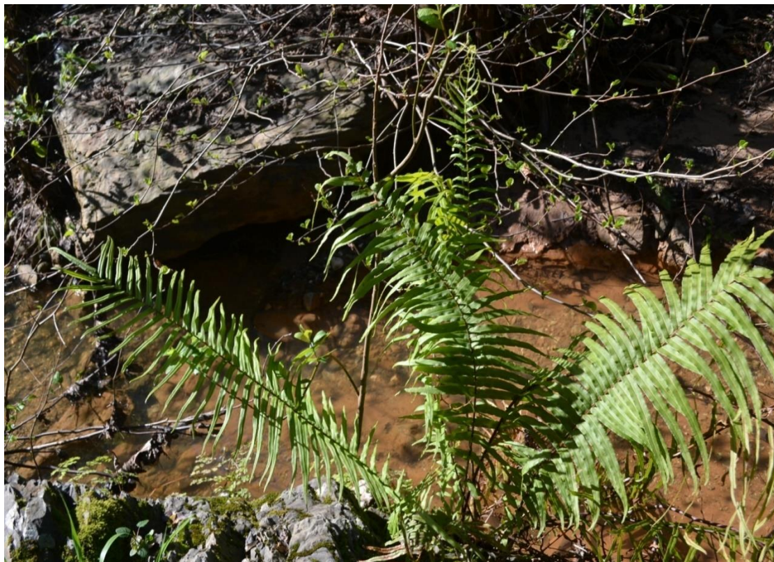
Figure 2. Pteris vittata L. dans son habitat (plage Saint Louis, 19/02/2016).