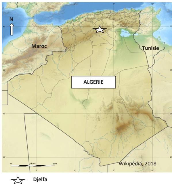
Figure 2: Localisation géographique de la station d'observation de Centaurea hyalolepis Boiss. en Algérie.

Figure 2: Geographical location of Centaurea hyalolepis Boiss observation station in Algeria.