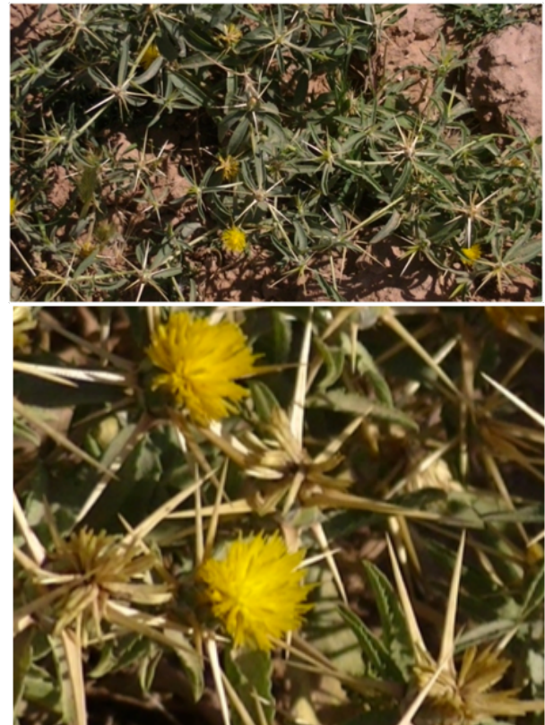
Figure 3: Illustration de Centaurea hyalolepis Boiss. (Djelfa, 20.6.2015,).

Plus d'une trentaine d'individus de Centaurea hyalolepis ont été observés sur les bords des routes et des champs dans la région de Djelfa (Fig. 2). Un spécimen d'herbier collecté a été déposé dans l'herbier officiel de l'école nationale supérieure agronomique d'Alger (Herbarium de