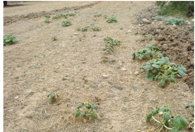
Figure 3. Individus d' Ibicella lutea dans un champ de céréale. Akbou (photo: K. Rebbas, 9.8.2018).

des plantes à licorne. Aux États-Unis, en Amérique du Sud et en Europe, les jeunes fruits de Proboscidea et d' Ibicella sont consommés sous forme de légumes et de cornichons (Bretting, 1984).