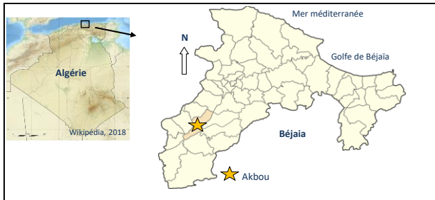
Figure 2. Localisation géographique de la station d'observation d' Ibicella lutea .

Nous avons observé plus de cinquante individus d' Ibicella lutea dans un champ de céréale, dans la région d'Akbou (Figs. 2 et 3).