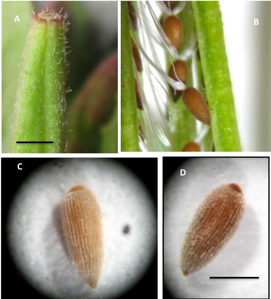
Figura 2. Epilobium ciliatum . A. Parte superior del fruto. B. Valvas del fruto y semillas maduras con la coma. C and D. Semillas vistas en lupa binocular. Escalas A y B = 1 mm, C y D = 0,5 mm. (Del pliego Fernández-Alonso 29832 (MA)). Epilobium ciliatum . A. Top of the fruit. B. Valves of the fruit and mature seeds with the coma. C and D. Seeds binocular views. Scales A and B = 1 mm, C and D = 0,5 mm. (From the voucher Fernández-Alonso 29832 (MA)).

parte, aunque, como se indica en Flora Ibérica (Nieto, 1997) E. obscurum presenta “papilas prominentes dispuestas a lo largo de líneas longitudinales claras”, estas papilas gruesas y