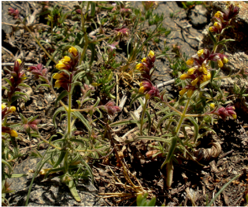
Figura 2. Odontites viscosus subsp. granatensis , Capileira (Granada), Sierra Nevada, bco. De Río Seco, 20/08/2009.