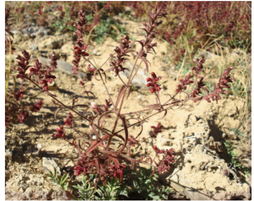
Figura3. Odontites viscosus subsp. granatensis , Monachil (Granada), Sierra Nevada, Collado de las Sabinas, 11/08/2007.

Gracias al hallazgo de estas nuevas localidades, así como a los esfuerzos de conservación realizados en la población clásica, englobados en las iniciativas recogidas en el Plan de Recuperación y Conservación de Especies de Altas Cumbres de Andalucía (Anónimo, 2012a), mejora ligeramente el diagnóstico sobre su estado de conservación, aunque la reevaluación de la categoría de amenaza con los criterios UICN (2012) lo mantiene en la máxima categoría de amenaza: CR B1b(ii,iii)c(iv)+2b(ii, iii)c(iv). Teniendo en cuenta su especificidad ecológica, las prospecciones exhaustivas realizadas y la escasez de zonas potencialmente óptimas para su desarrollo, es poco probable la aparición de nuevos núcleos poblacionales. Por tanto, se estima urgente seguir impulsando el Plan de Recuperación y Conservación de Especies de Altas Cumbres de Andalucía, controlando la predación por parte de grandes ungulados, tanto domésticos (bovino y ovino) como silvestres ( Capra pyrenaica Schinz subsp. hispanica Schimper); para ello, se estima como una medida muy efectiva el levantamiento de pequeños cercados de exclusión temporal, que permitan la dinámica natural propia de sus comunidades vegetales y, a la vez, protejan