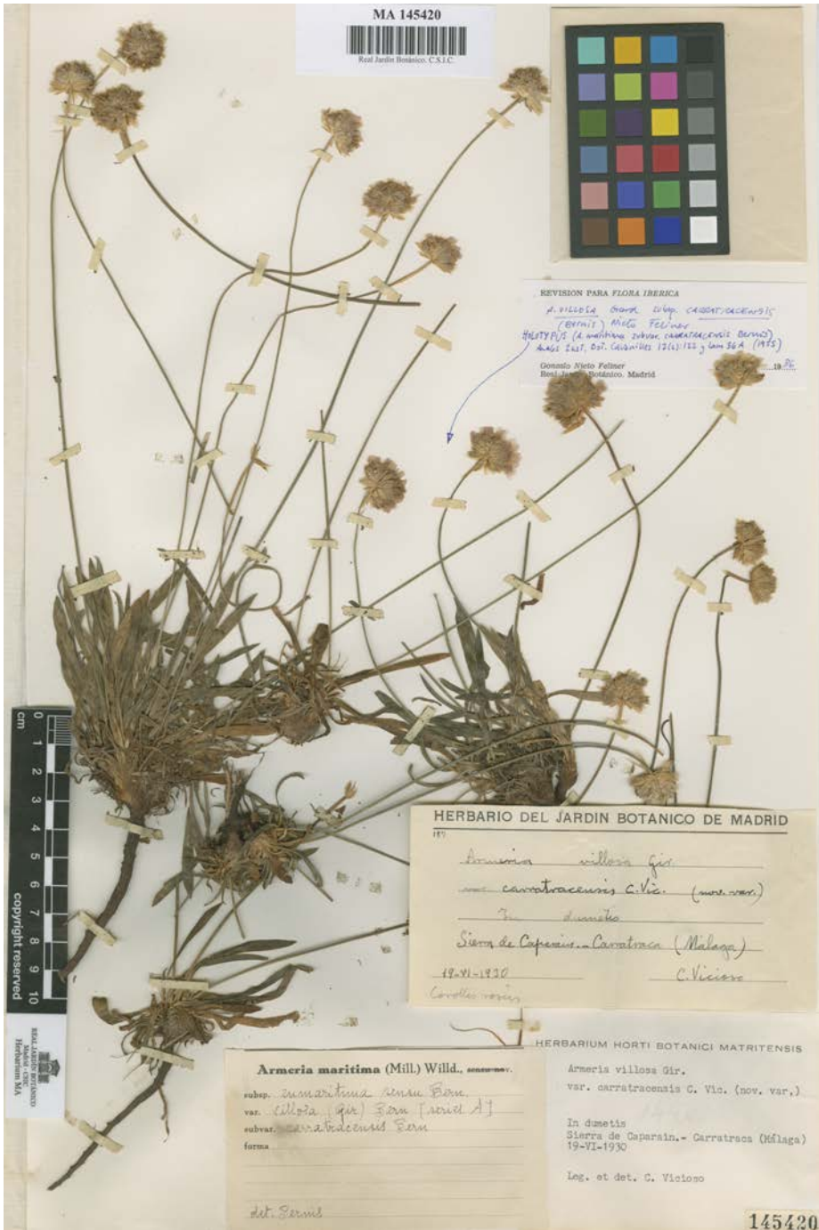
Figura 1. Holotypus de Armeria grajoana . Holotype of Armeria grajoana .