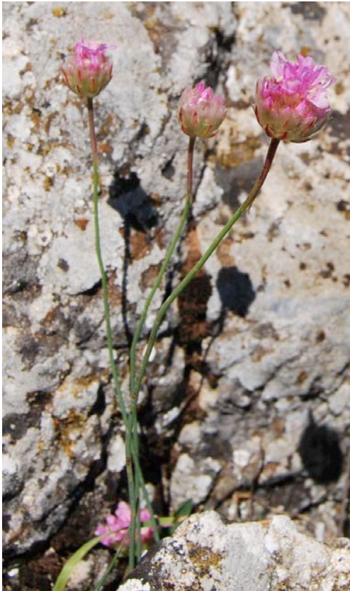
Figura 3. Armeria grajoana . Escapo e inflorescencia. Inflorescence branch.

Especies Silvestres en Régimen de Protección Especial incluido el Catálogo Andaluz de Especies Amenazadas como especie amenazada con la categoría de En Peligro de Extinción (EN) .