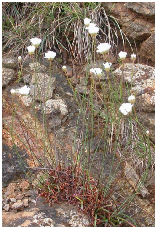
Figura 6. Armeria villosa subsp. serpentinicola . Aspecto general de la planta. Biotype .

Observaciones. En un interesante trabajo sobre hibridaciones en el género Armeria y mas concretamente sobre el origen híbrido de A. villosa subsp. carratracensis (Nieto Feliner et al. , 1996) se pone de manifiesto la relación de esta subespecie con A. colorata (peridotitas) y A. villosa subsp. longiaristata (calizas/dolomías). El material utilizado de A. villosa subsp. carratracensis (Bernis) Nieto Feliner para este estudio procede de la Sierra de Aguas (peridotitas/serpentinatas), por lo que los resultados no pueden ser aplicados a la entidad A. grajoana de la Sierra de Alcaparaán