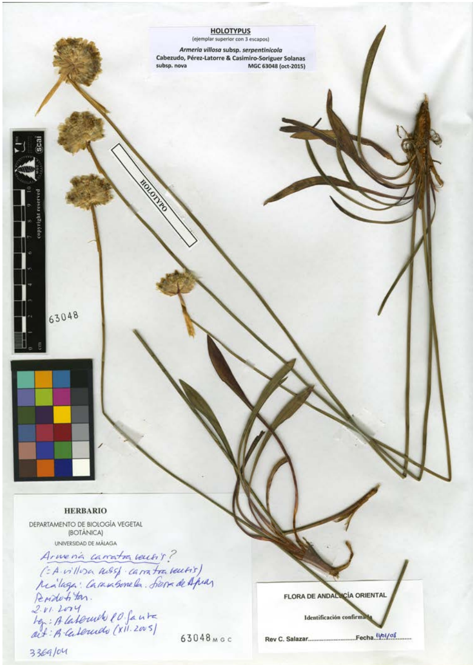
Figura 4. Holotypus de Armeria villosa subsp. serpentinicola . Holotype of Armeria villosa subsp. serpentinicola .