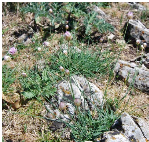
Figura 2. Armeria grajoana . Aspecto general de la planta. Biotype .

Hemicript6f6ito con cepa ramificada y vertical de ramas muy apretadas. Cepa cubierta de hojas viejas que se deshacen en fibras. Planta glabra, excepto generalmente las hojas. Hojas (25)30-70 (95)x(2,5)3-5(6) mm., homomorfas, lanceoladas, patentes o erectas, generalmente atenuadas en un largo peciolo, con margen escarioso estrecho, de glabras a generalmente ciliadas exclusivamente en el margen; con granulaciones blancas en el limbo. Escapos (12)15-18(20) cm., de rectos a flexuosos en su mitad superior, glabros. Involucro 1,4-1,8 (2) cm. Vaina involucral de longitud similar al di6metro del involucro o frecuentemente algo menor 4/5. Br6ctea involucral 7-12, lisas, glabras, con margen escarioso, generalmente crecientes en tama6o de las externas a las