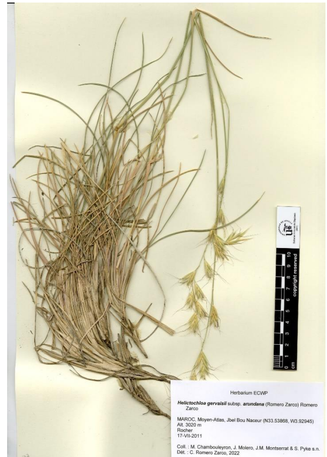
Figure 2. Helictochloa gervaisii subsp. arundana (Romero Zarco) Romero Zarco: Moyen-Atlas, Jbel Bou Naceur (17-VII-2011; N33.53868, W3.92945).

Vallée de la Moulouya (Op-2): El Ksabi, Tamdafelt (N32.87722, W4.24889), 980 m, culture, 26-V-2022,