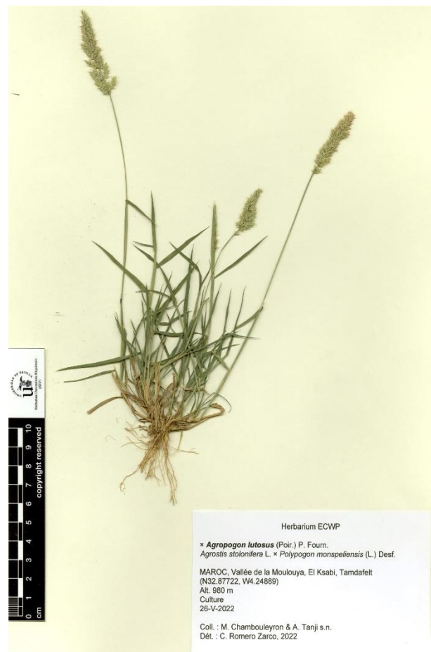
Figure 4. × Agropogon lutosus : Vallée de la Moulouya (Op-2), El Ksabi, Tamdafelt (26-V-2022 ; N32.87722, W4.24889).