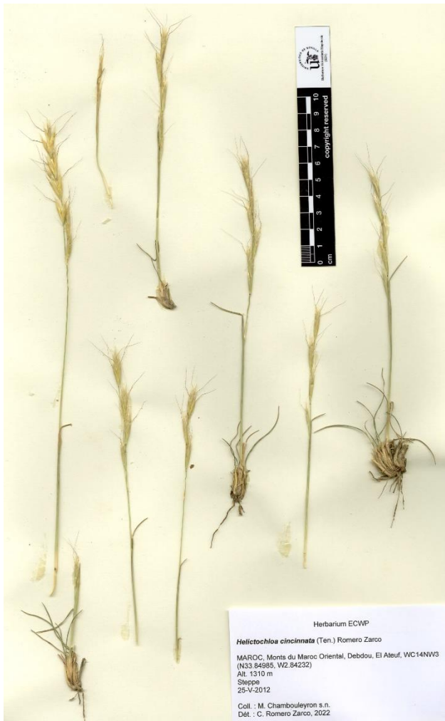
Figure 1. Helictochloa cincinnata : Monts du Maroc Oriental, El Ateuf (25-V-2012 ; N33.84985, W2.84232).

≡ Helictotrichon gervaisii subsp. arundanum (Romero Zarco) Röser in Diss. Bot. 145: 121 (1989)