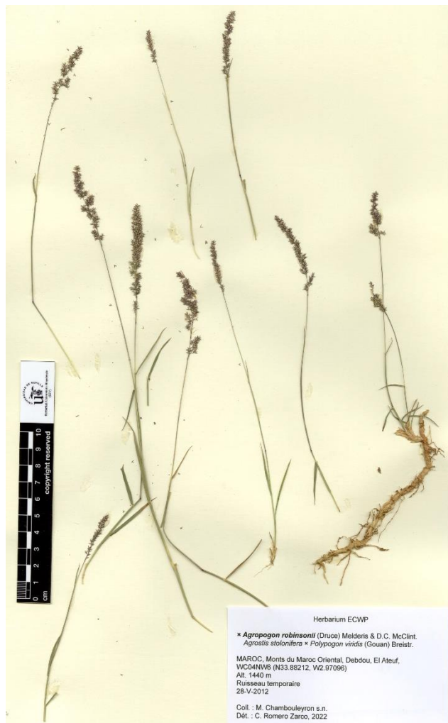
Figure 5. × Agropogon robinsonii : Monts du Maroc Oriental (Om-3), au sud de Debdou: Sidi Ali Belkassam (28-V-2012; N33.88212, W2.97096).

Monts du Maroc Oriental (Om-3), au sud de Debdou: Sidi Ali Belkassam (N33.88212, W2.97096), 1440 m, ruisseau temporaire, 28-V-2012, M. Chambouleyron s.n. (ECWP) (Figure 5).