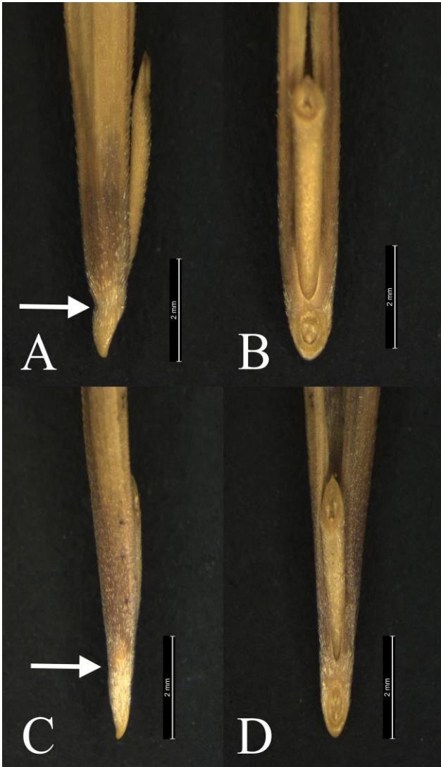
Figura 2. Parte inferior del lema y callo. A y B, Bromus diandrus (Cádiz, entre Benaocaz y Ubrique, calizas, SEV 102756): A, visión lateral; B, visión adaxial. C y D, B. rigidus , Huelva, Palos de la Frontera, turbera (SEV 101910): C, visión lateral; D, visión adaxial. Las flechas indican el punto de unión entre la base del lema y el callo. Figure 2. Lower part of the lemma and callus. A and B, Bromus diandrus , Cádiz, between Benaocaz and Ubrique, limestone (SEV 102756): A, lateral view; B, adaxial view. C and D, B. rigidus , Huelva, Palos de la Frontera, peatbog (SEV 101910): C, lateral view; D, adaxial view. Arrows indicate the point of union between the base of the lemma and the callus.

con callo destacado en visión lateral, tal como lo describen Maire & Weiller (op. cit.), mientras que en la Figura 4 se representan otras dos muestras más parecidas a las de B. rigidus , tal como las describe Talavera (1987). Otros caracteres, como la panícula más laxa en B. diandrus , son variables. Tanto B. rigidus como B. macrantherus crecen en terrenos arenosos, si bien la segunda especie casi siempre se encuentra en arenales costeros, mientras que la primera puede encontrarse también en arenales del interior. Por el contrario, B. diandrus habita en herbazales nitrófilos y lugares alterados con substratos variados.