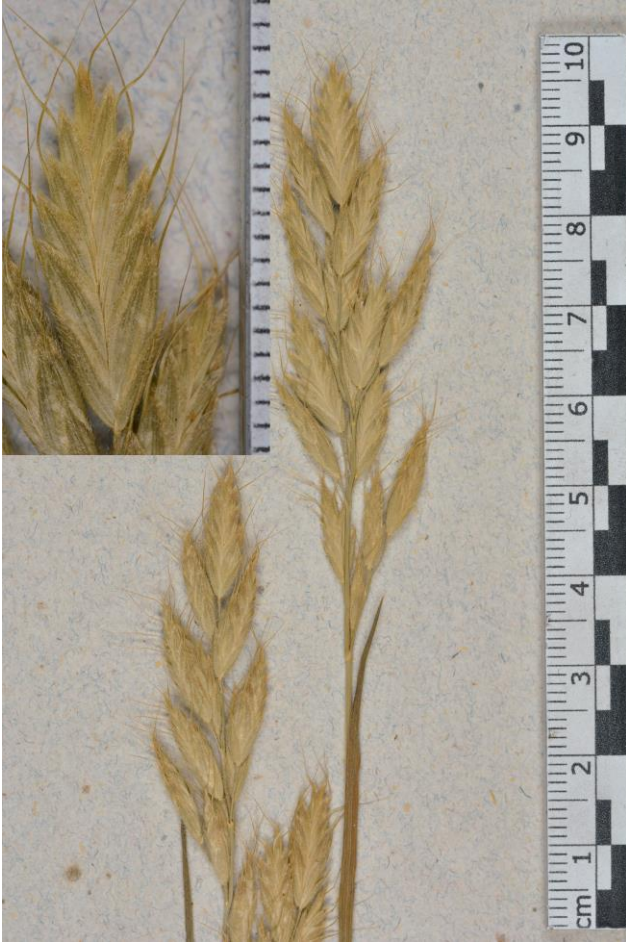
Figura 1. Panícula y una espiguilla del lectotipo de Bromus hordeaceus subsp. divaricatus (Bonnier & Layens) Kerguelén. Francia: departamento de Loira Atlántico, Pornic, arenas marítimas, 7-VI-1840 [J. Lloyd], ANG s/n.

Lectotipo (designado aquí): " Bromus molliformis Nob. // Sables maritimis // Pornic // June 7. 1840." [scripsit J. Lloyd], ANG s/n, foto! (Figura 1).