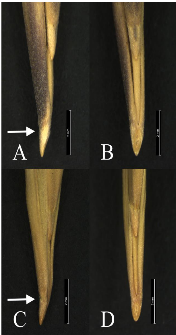
Figura 4. Parte inferior del lema y callo en dos muestras de Bromus macrantherus con el callo no destacado del lema. A y B, Cádiz, Chiclana, cunetas (SEV 102168): A, visión lateral; B, visión adaxial; C y D, Baixo Alentejo, Setúbal, península de Troia, dunas e ruderal (SEV 121053): C, visión lateral; D visión adaxial. Las flechas indican el punto de unión entre la base del lema y el callo.

Sevilla. Entre Morón y Pruna, cercanías del Cerro del Peñón, 26-V-1976, E. Ruiz de Clavijo (SEV 30562). Sevilla, feria [terrenos del recinto ferial de Los Remedios-Tablada], 14-IV.1981, F. Amor et al. (SEV 257237), con etiqueta de revisión de Acedo & Llamas de octubre de 2020 como B. rigidus . Toledo. Navalcán, 23-V-1983, Ruiz Téllez (SALA 68802).