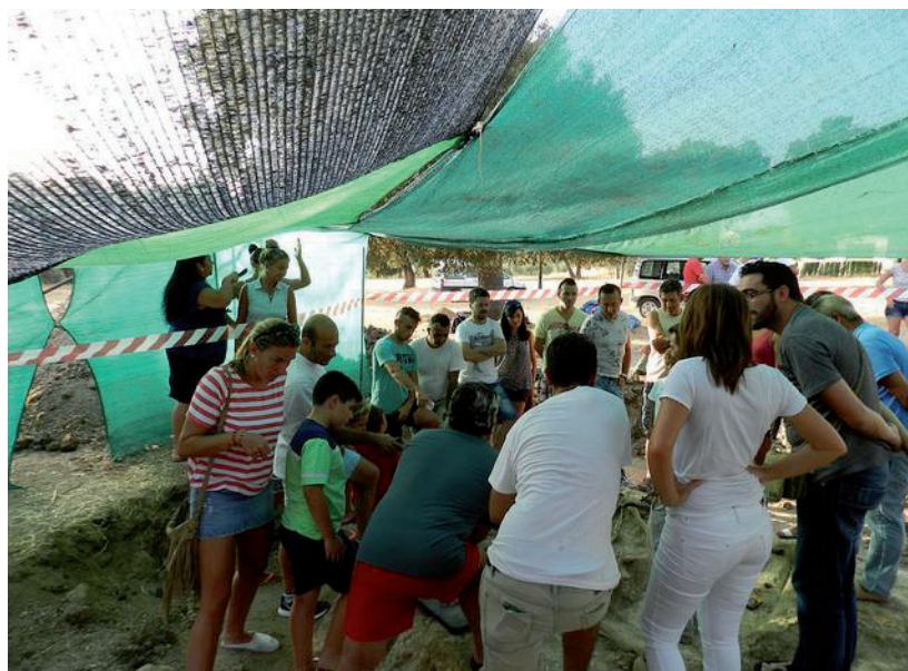
Fotografía 2. Fotografía perteneciente al álbum fotográfico de la exhumación de una fosa común por la Asociación para la Recuperación de la Memoria Histórica en el cortijo El Baldío (Alcalá del Valle, Cádiz, España).