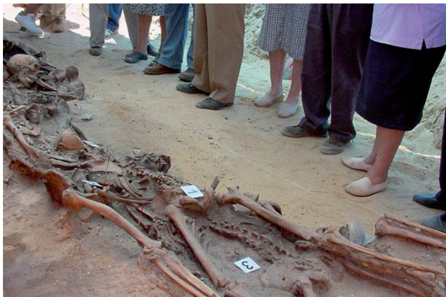
Fotografía 1. Restos de una fosa común de la Guerra Civil.

La Memoria Histórica de la Guerra Civil es un problema que llega hasta la actualidad, apareciendo como uno de los grandes temas de debate en la sociedad española (Rengel, 27 de diciembre 2017). Por tanto, su estudio en las aulas de Bachillerato resulta indispensable a la hora de abordar la Guerra Civil.