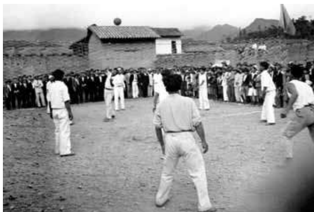
Figura 9. Exhibición voleibol, Loja, Ecuador, s/f.

La imagen que se observa a continuación, fue tomada en Quito, en 1950 observándose la fina de un campeonato barrial de ecuavóley, se puede observar la presencia de una gran cantidad de espectadores, siendo la evidencia del primer campeonato de ecuavóley registrado.