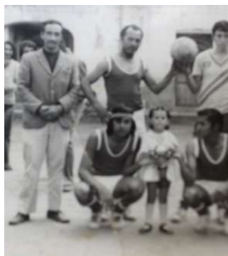
Figura 14. Inauguración ecuavóley, 1970.

Mientras que en la Figura 13 y 14 se muestran fotografías de la inauguración del campeonato de ecuavóley realizado en la “Sociedad Artística”, provincia de Imbabura, cantón Otavalo.