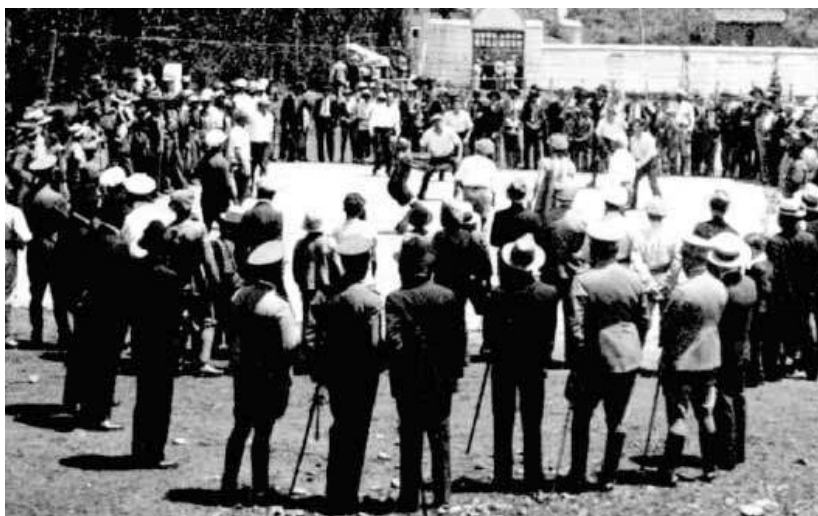
Figura 10. Campeonato de ecuavóley, Quito, Ecuador.

La Figura 11 también fue realizada en Quito, final del campeonato interprovincial de ecuavóley, realizada en las canchas del Colegio Mejía, observándose nuevamente los centenares de espectadores, la característica de las redes actuales con figuras de rombos y un balón de fútbol muy desgastado debido a la superficie de la cancha “cemento”.