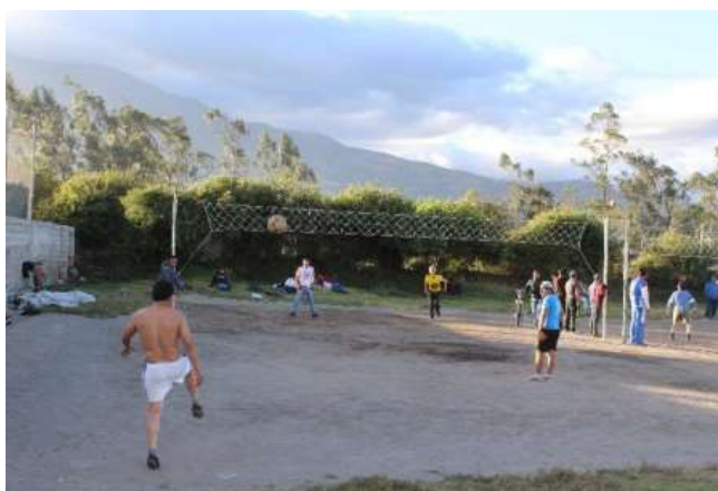
Figura 3. Partido ecuavóley dos a dos, sacando con el pie, Cotacachi, Ecuador.

Este tipo de variantes pueden ser trabajadas de una manera lúdica y recreativa en las instituciones educativas, brindando nuevas formas de enseñanza en Educación Física, potenciando la formación integral de alumnos y alumnas, dándole un sentido educativo al ecuavóley, como ha ocurrido con la mayoría de deportes desde los inicios de la humanidad, que fueron concebidos como una práctica para la supervivencia hasta que comenzaron a contener contenido educativo, transformando el concepto y otorgándole variedad de interpretaciones, que han influenciado a la cultura y educación de hoy (Sainz, 1992; Blanco, 2016).