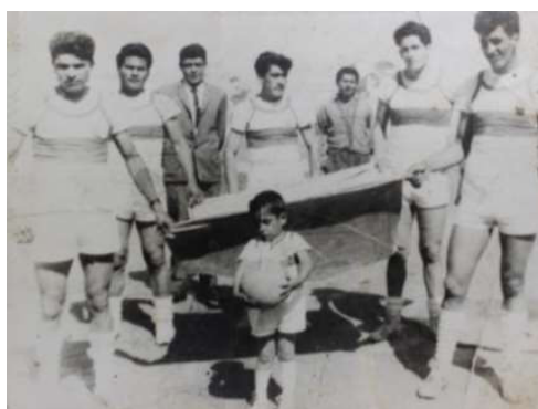
Figura 13. Inauguración campeonato de ecuavóley.

En la provincia de Imbabura, específicamente en el cantón Otavalo el ecuavóley era popular desde 1950, en la Figura 13 se observa un equipo totalmente uniformado y con una bandera, en el evento de inauguración.