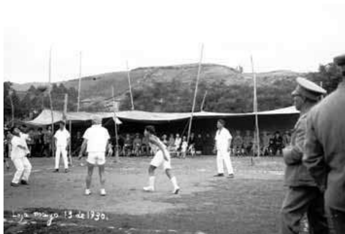
Figura 6. Exhibición, Loja, Ecuador 1930.

En la Figura 6 se puede observar una banda marcial, ubicada al contorno de una cancha de ecuavóley, personas sentadas bajo viseras improvisadas, mientras 5 personas juegan en una cancha rectangular evidenciando una red de ecuavóley en la mitad. En la parte inferior izquierda existen escritos que dicen: Loja, mayo 13 de 1930.