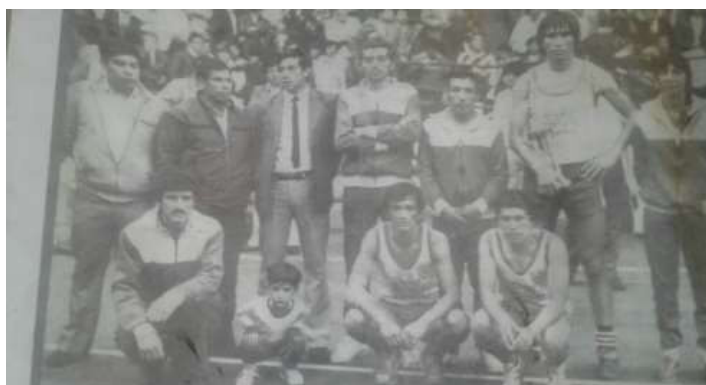
Figura 12. Final campeonato de ecuavóley, s/f.

En la provincia de Imbabura, específicamente en el cantón Otavalo el ecuavóley era popular desde 1950, en la Figura 13 se observa un equipo totalmente uniformado y con una bandera, en el evento de inauguración.