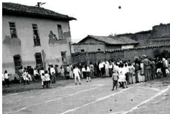
Figura 8. Loja, Ecuador 1935.

En la Figura 8 , se puede apreciar un grupo de personas observando un encuentro deportivo, en el cual están jugando hombres y mujeres, se distingue nuevamente 5 personas a cada lado de la cancha, situación por la cual no se puede afirmar si es partido de ecuavóley o voleibol, pero destaca un gran número de personas observando, desde aquella época se daban cita a observar el juego.