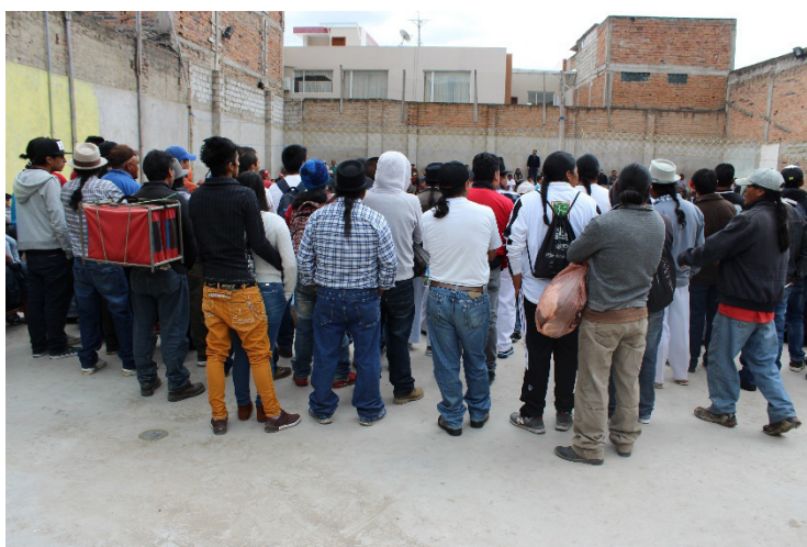
Figura 1. Complejo deportivo ecuavóley, Otavalo, Ecuador.

En este orden de palabras, es clave mencionar que en cada rincón del territorio ecuatoriano que se visite se encuentra una cancha de ecuavóley (Figura 1), a sus alrededores negocios de comida o bares, y cientos de personas de todas las edades dándose cita a jugar u observar un partido.