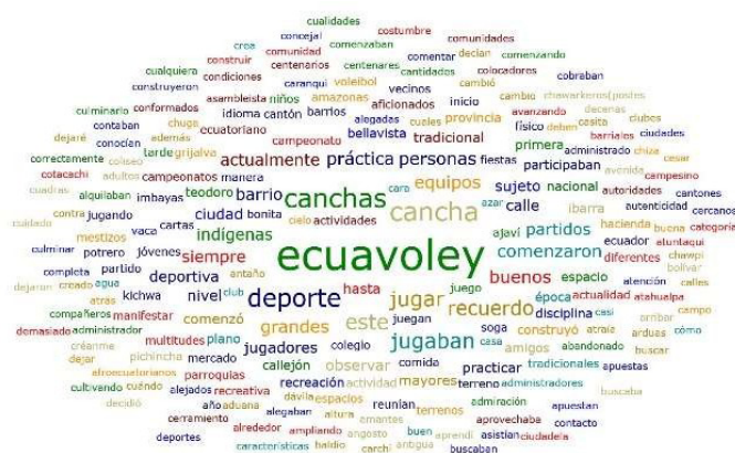
Figura 4. Nube de palabras entrevistas.

Mediante este análisis estadístico del programa cualitativo ATLAS.ti se puede observar claramente que el término “ecuavóley” era conocido desde los inicios de la práctica de este deporte, evidenciándose que en 1950 ya llevaba este nombre, contrastando con la teoría que era llamado “vóley criollo”, hasta antes de la década de los setenta, resultados que coinciden con el criterio de Galeano (2003). La investigación cualitativa permite analizar datos descriptivos, así como el comportamiento observable de la persona, permitiendo conocer la realidad social, así como el comportamiento observable de la persona y su verdadera historia.