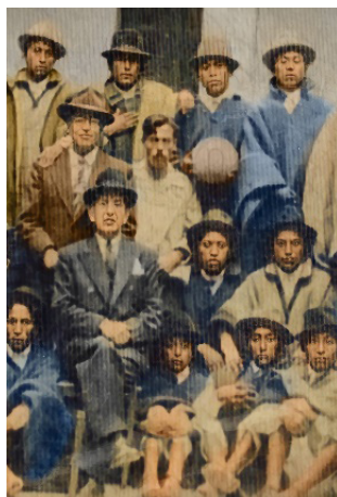
Figura 5. Indígenas junto al dueño de hacienda, Imbabura, Ecuador, inicios de 1900.

Iniciando con el análisis en la búsqueda del origen del ecuavóley, se puede observar en la figura 5 , una foto inédita colorizada digitalmente en la que se puede observar indígenas Imbabureños, posiblemente Otavalos junto a los dueños de hacienda en las manos una pelota de ecuavóley, marcando los inicios de esta práctica deportiva.