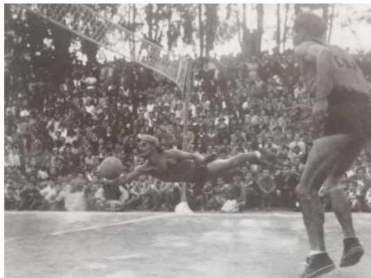
Figura 11. Final campeonato de ecuavóley, 1952.

El siguiente recorte de periódico fue registrado en el cantón Cayambe, provincia de Pichincha se desconoce la fecha exacta en la que fue realizada la fotografía.