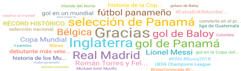
Figura 1. Nube de etiquetas analizadas en un proyecto de social listening

A pesar de que el objetivo principal de estas acciones de medición es obtener información para abordar mejores acciones de marketing por las empresas y obtener el mejor retorno de inversión, cada día la extracción de información para el incremento del valor reputacional de la marca es más extendido.