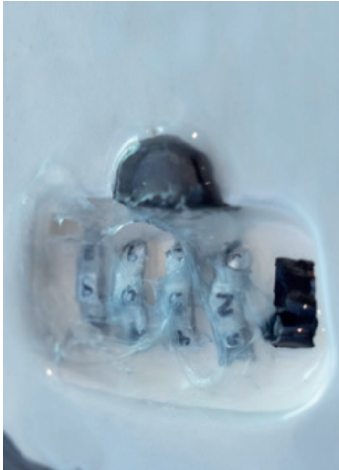
Figura 4. Excelente Ubicación. Locker cerámico (2023).

Fuente: Uve MTZ (2024). Extraído de: Vázquez de la Rosa, H. y González, L. (2024a). Málaga Paradise. La Exposición . Universidad de Málaga. https://doi.org/10.24310/mumaedmumaed.204