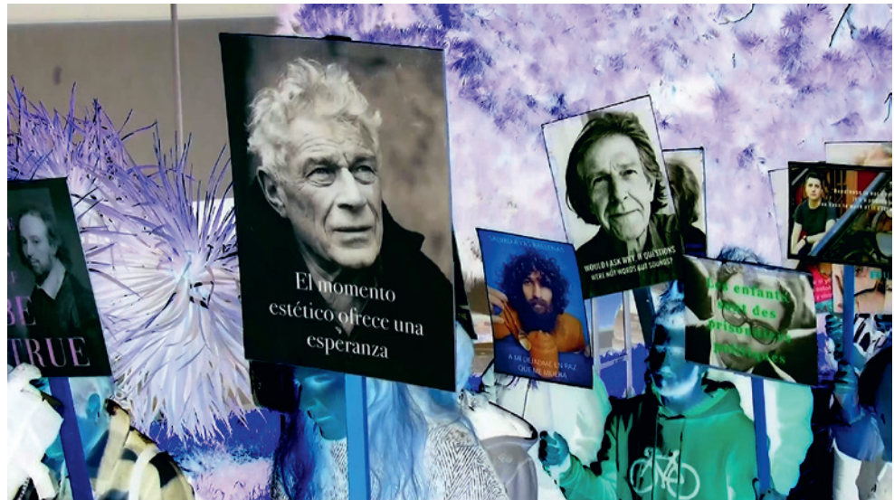
Imágenes fijas del video final, primera parte DEMONSTRATION- LEITMOTIV

El espacio del Laboratorio de Experimentación sirvió pues para hacer la presentación del making of mediante una video-proyección, mientras que la obra ya editada en ese momento, en apenas cuarenta y ocho horas, se presentó en formato de pantalla de plasma de mediano/gran formato. Del mismo modo, y rodeando todo el espacio del Laboratorio, se expusieron físicamente todas y cada una de las pancartas utilizadas durante la manifestación.