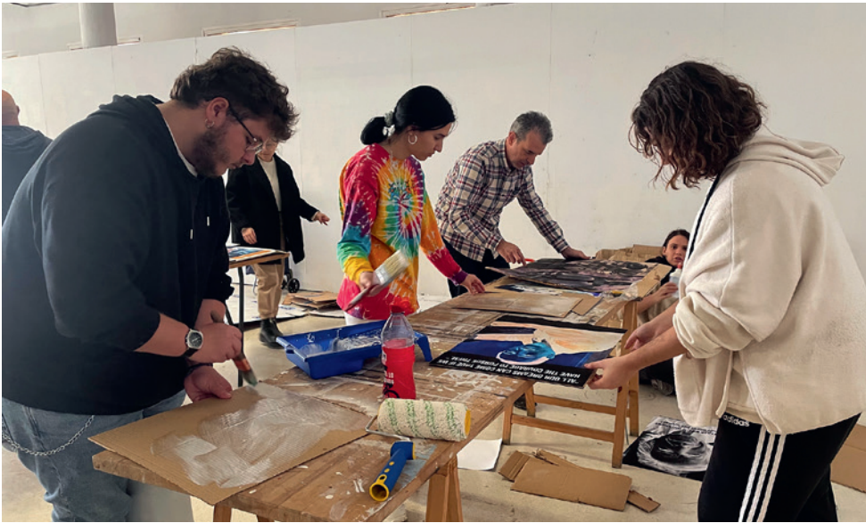
Preproducción física DEMONSTRATION-LEITMOTIV

DEMONSTRATION-LEITMOTIV , tanto en su dimensión de workshop como en la de ejecución de una obra artística de carácter relacional y colaborativo (cuyos contenidos conceptuales no viene al caso relatar en esta introducción sino en un artículo en esta misma publicación que tiene como fin esa tarea), tenía como premisa la producción de una manifestación pública en la que los participantes portaran una pancarta, generada en casi todos los casos por sus propias mentes y manos, en la que manifestaban la selección individual de la imagen de un personaje público, vivo o ya fallecido que hubiese emitido algún tipo de mensaje de carácter breve en forma de sentencia, eslogan, aforismo, comentario, etc. Es decir, cada participante debía elegir la imagen de un personaje con el que podía identificarse por alguna razón personal y privada, y añadirle una frase enunciada por ese mismo personaje. Eso daría lugar a una pancarta con unas características determinadas y que sería elaborada por los/las participantes durante el workshop . Yo negativizaba la imagen y la frase mediante procedimientos digitales, y acordaba un tamaño determinado con quienes habían seleccionado personaje y frase. Por supuesto, cada quien era libre de seleccionar su personaje referente acudiendo a sus preferencias, gustos e intereses absolutamente personales.