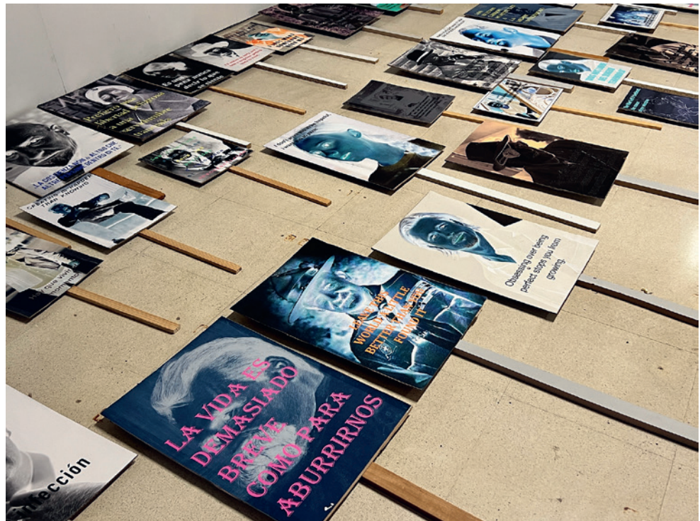
Preproducción física DEMONSTRATION-LEITMOTIV