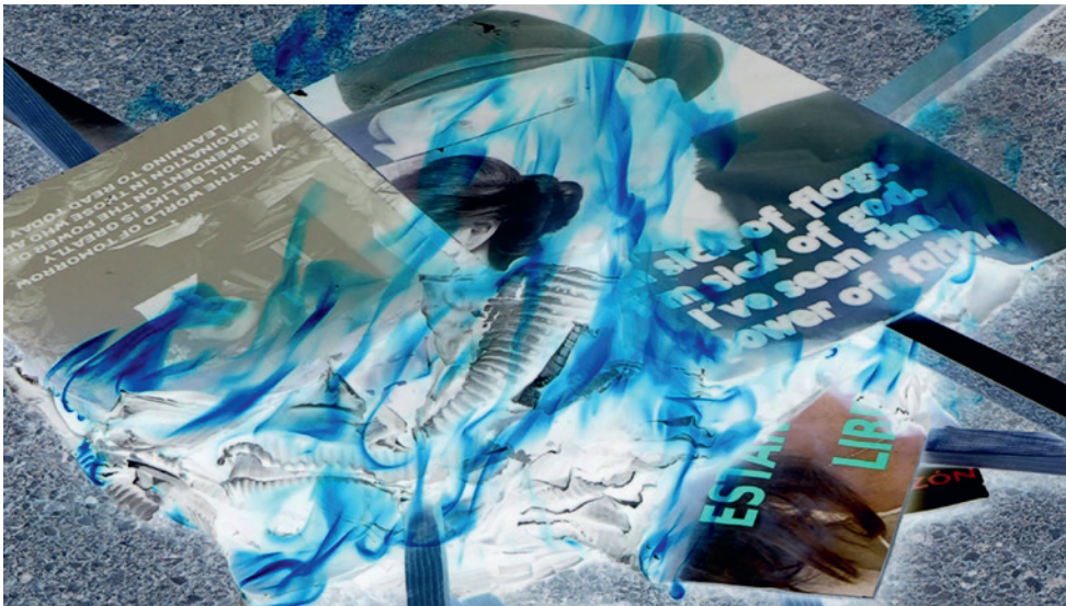
Imagen fija del vídeo final, segunda parte DEMONSTRATION-LEITMOTIV

Posteriormente a todo esto, y aunque la idea me rondaba desde hacía tiempo, me decidí a culminar la obra con un segundo vídeo. En lo que se podría considerar la otra cara de la moneda, esta segunda parte consiste en la quema de las pancartas en una pira utilizando igualmente el negativo, de modo que las llamas y el contexto de las pancartas se aprecian en negativo mientras que las pancartas, en positivo, arden entre llamas azuladas y acompañadas de las crepitaciones de la hoguera. Cabe aquí mi agradecimiento al parque de bomberos emplazado en el Parque Tecnológico de Málaga por su disponibilidad para poder realizar esta acción con las máximas garantías de seguridad.