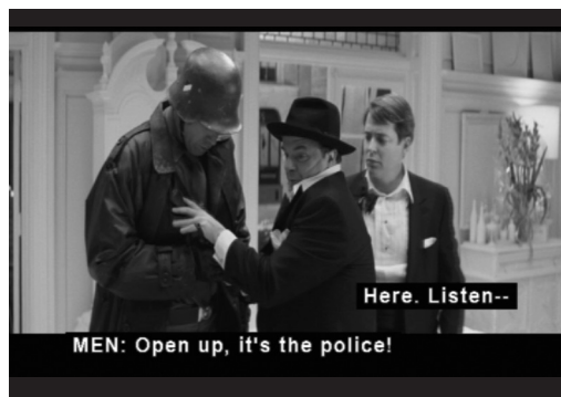
Figura 2. Fotograma con subtítulos para sordos

Una vez que el alumno es capaz de utilizar correctamente el apoyo de los subtítulos, pudiendo prestar atención simultáneamente a los subtítulos y a la pista auditiva del documento audiovisual, también podrá ser capaz de realizar actividades en las que se olvide progresivamente del canal escrito, llegando a comprender, en última instancia, la información oral del material audiovisual auténtico o semi-auténtico sin ayuda del texto; esto es, en definitiva, el fin último de