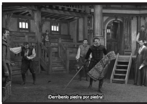
Figura 4. Fotograma con subtítulos tradicionales

audición. Entre estos rasgos destaca el hecho de que diferencian los parlamentos de los distintos personajes (por medio de colores, con etiquetas o posicionándolos en pantalla junto al personaje), dan cuenta de la dimensión paralingüística de la pista sonora (por ejemplo, «se oyen disparos»). Se llaman también subtítulos cerrados porque su utilización es opcional, es decir, se eligen mediante el mando a distancia, el teletexto o un decodificador específico (Gottlieb, 1998). Este tipo de emisiones se conocen también como Closed Captioned TV (CCTV) o televisión con subtítulos cerrados. Aunque este tipo de subtítulos se crearon originariamente para beneficiar a personas con dificultades de audición, su uso se fue extendiendo, en los Estados Unidos originariamente, a la población inmigrante, que hacía uso de estos subtítulos para comprender mejor las emisiones de televisión en una lengua para ellos extranjera (Huang, 1999). En España, el SpS está disponible hoy en día gracias al teletexto de las cadenas de televisión nacionales y algunos DVD. Se puede apreciar un ejemplo de este tipo de subtítulos en la figura 2, que reproduce una imagen perteneciente a la película norteamericana The Producers (Susan Stroman, 2005).