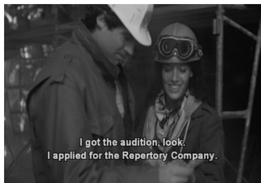
Figura 3. Fotograma con subtítulos bimodales

audición. Entre estos rasgos destaca el hecho de que diferencian los parlamentos de los distintos personajes (por medio de colores, con etiquetas o posicionándolos en pantalla junto al personaje), dan cuenta de la dimensión paralingüística de la pista sonora (por ejemplo, «se oyen disparos»). Se llaman también subtítulos cerrados porque su utilización es opcional, es decir, se eligen mediante el mando a distancia, el teletexto o un decodificador específico (Gottlieb, 1998). Este tipo de emisiones se conocen también como Closed Captioned TV (CCTV) o televisión con subtítulos cerrados. Aunque este tipo de subtítulos se crearon originariamente para beneficiar a personas con dificultades de audición, su uso se fue extendiendo, en los Estados Unidos originariamente, a la población inmigrante, que hacía uso de estos subtítulos para comprender mejor las emisiones de televisión en una lengua para ellos extranjera (Huang, 1999). En España, el SpS está disponible hoy en día gracias al teletexto de las cadenas de televisión nacionales y algunos DVD. Se puede apreciar un ejemplo de este tipo de subtítulos en la figura 2, que reproduce una imagen perteneciente a la película norteamericana The Producers (Susan Stroman, 2005).