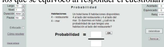
Figura 3. Cuestionario sobre probabilidad

En caso de no contestar correctamente, el resumen también muestra una corrección de los problemas, apareciendo el enunciado de dicho problema, la solución correcta y la respuesta entregada por el usuario. El recurso también entrega un enlace con la posibilidad de que el usuario corrija sus errores, contestando nuevamente los problemas en los que se equivocó al responder el cuestionario.