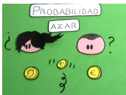
Figura 4. Cómo se resuelve un problema de probabilidad http://educacion.practicopedia.lainformacion.com/matematicas/como-se-resuelve-un-problema-de-probabilidad-10823