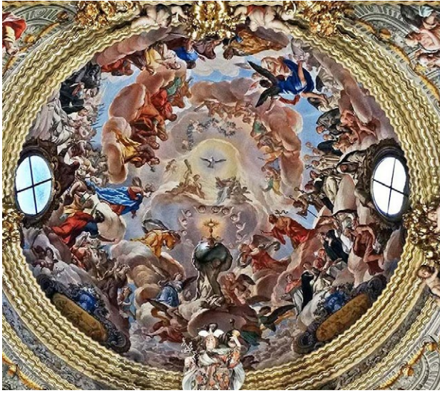
1. Acisclo Antonio Palomino, El triunfo de la Iglesia militante , 1712. Sancta sanctorum, Monasterio de la Cartuja, Granada.