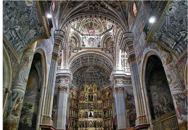
8. Pinturas murales. Iglesia del Monasterio de San Jerónimo, Granada.