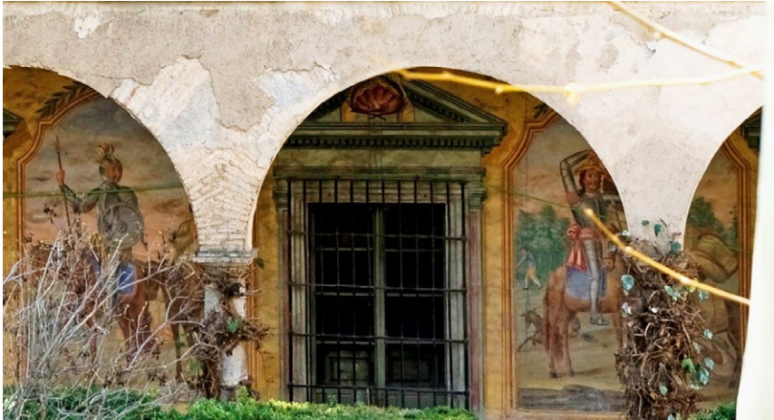
9. Antonio Jiménez, José Medina, Nicolás Martínez Tenllado, Las hazañas del Quijote , 1795. Palacio del Cuzco, Víznar (Granada).

artistas poco acreditados, y de escasa fortuna, su intervención en las pinturas murales del palacio del Cuzco queda compensada por tratarse de uno de los escasos ejemplos de ciclos pictóricos murales setecentistas de carácter civil conservados en Andalucía. Un asunto profano con un com-