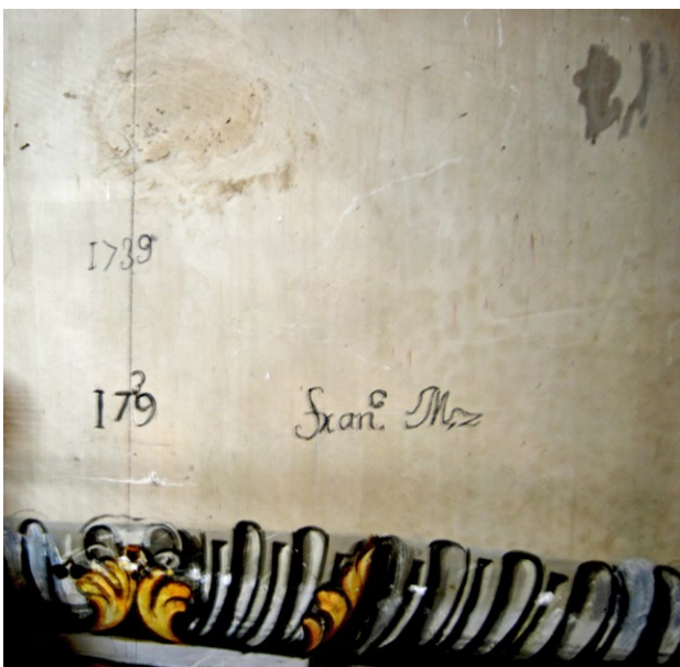
2. Eduardo y Francisco Martínez, Pinturas murales (detalle) , 1738. Monasterio de Santa Isabel la Real, Granada.

ello que la llegada de Palomino supondría un revulsivo para este tipo de práctica que tendría su continuidad más allá de mediados de siglo.