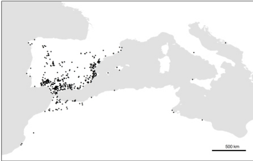
Figura 1. Mapa de la distribución de Urospermum picroides (L.) F.W. Schmidt (●) en el Oeste de la región Mediterránea reconstruida a partir del material de herbario estudiado. Distribution map of Urospermum picroides (L.) F.W. Schmidt (●) in Western Mediterranean, constructed from the studied herbarium vouchers.

o las más superiores enteras, ± pelosas por ambas caras; las inferiores generalmente oblanceoladas, atenuadas en la base del limbo en un peciolo ± largo y ancho; las caulinares medias y superiores sésiles, auriculadas, subamplexicaules, todas alternas o las más superiores subopuestas o pseudoverticiladas. Capítulos erectos antes de la antesis, solitarios o reunidos en una inflorescencia cimosa y oligocéfal, pedunculados, multifloros. Involucro campanulado en la floración, formado por 8 brácteas soldadas entre sí en el tercio inferior, dispuestas en 3 filas, la externa del tamaño de las internas; brácteas anchamente lanceoladas, las tres externas simétricas, enteramente herbáceas, las dos intermedias asimétricas, con un solo margen ampliamente escarioso, y las tres internas simétricas, con los márgenes ampliamente escariosos, ventralmente glabras. Receptáculo plano en la fructificación, cónico en la dispersión, alveolado, con los alvéolos de margen peloso, con los pelos más cortos que los ovarios, sin